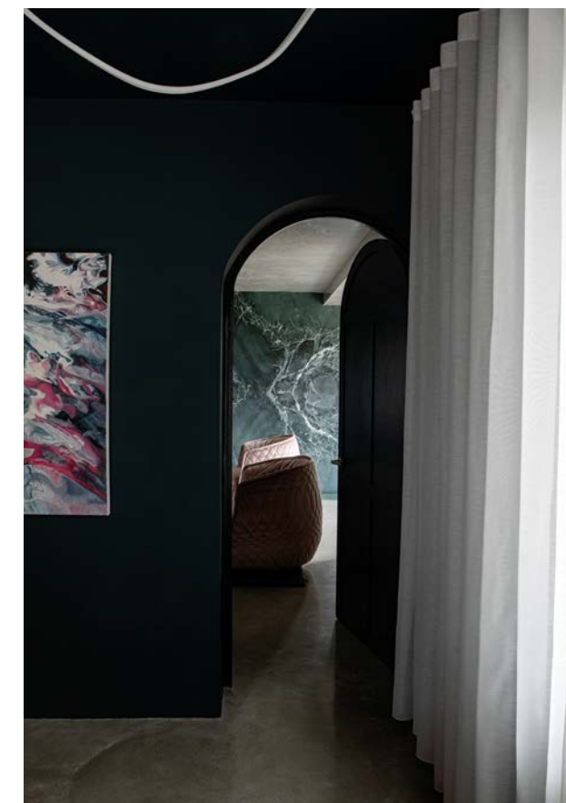
Kig til stuen gennem en blå, buet dør.