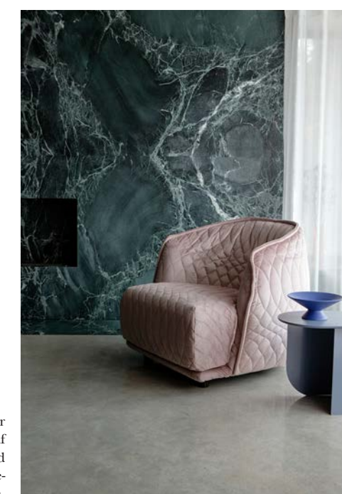
I et hjørne af stuen står Morosos Redondo-stol af Patricia Urquiola sammen med sidebordet Plateau af Terhed-brügge fra Fest Amsterdam.