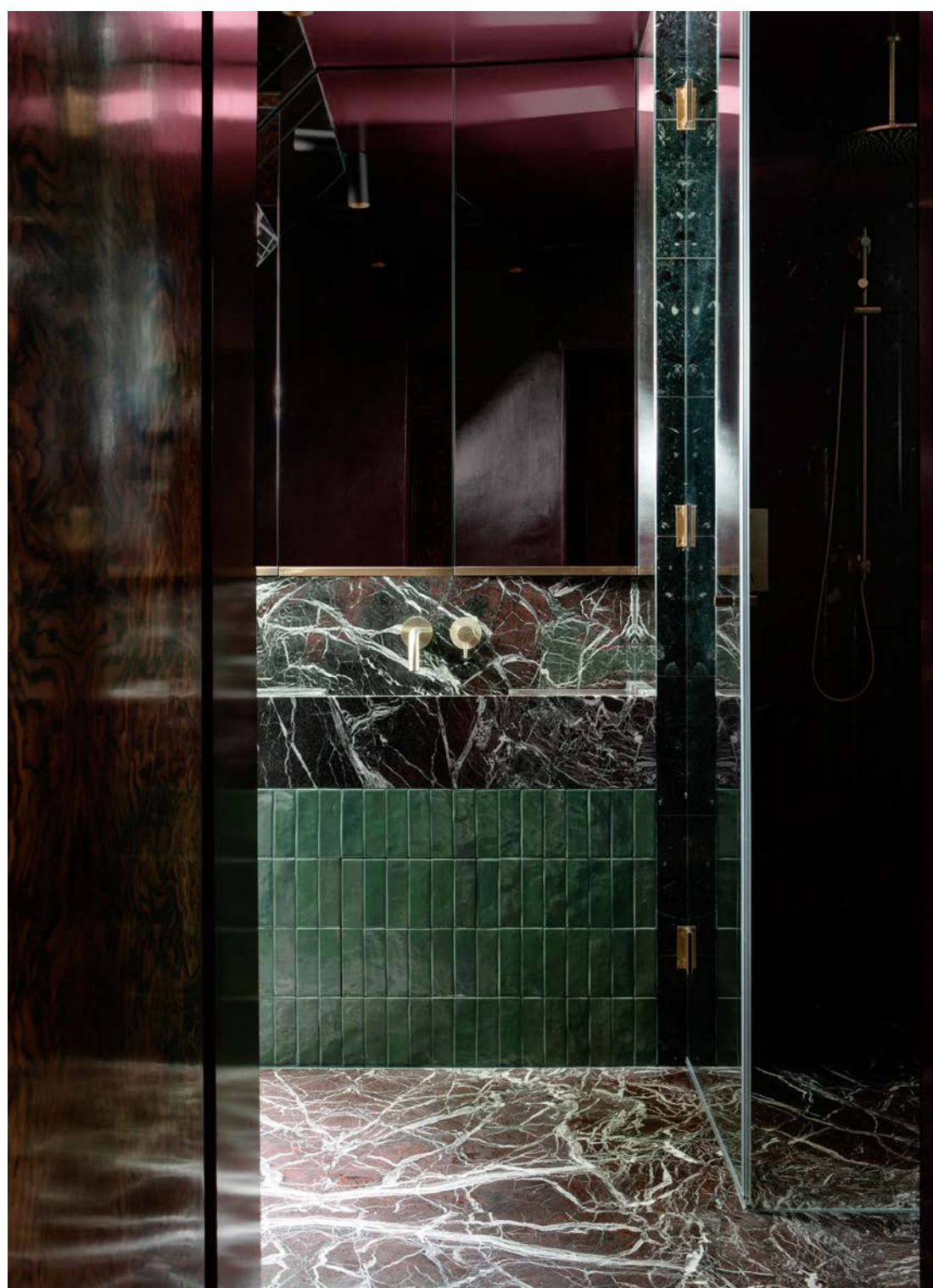
Badeværelset er en øvelse udi ren overdådighed og luksus, hvor Kingston Lafferty Design er gået all in på lækre materialer i en æstetik med et romantisk twist og et nik til 70'erne; Rosso Levanto-marmor på gulvet i et mix med flaskegrønne fliser og grønne terrazzo-fliser fra henholdsvis Wow Design og Tilestyle. Armaturer fra Vos.