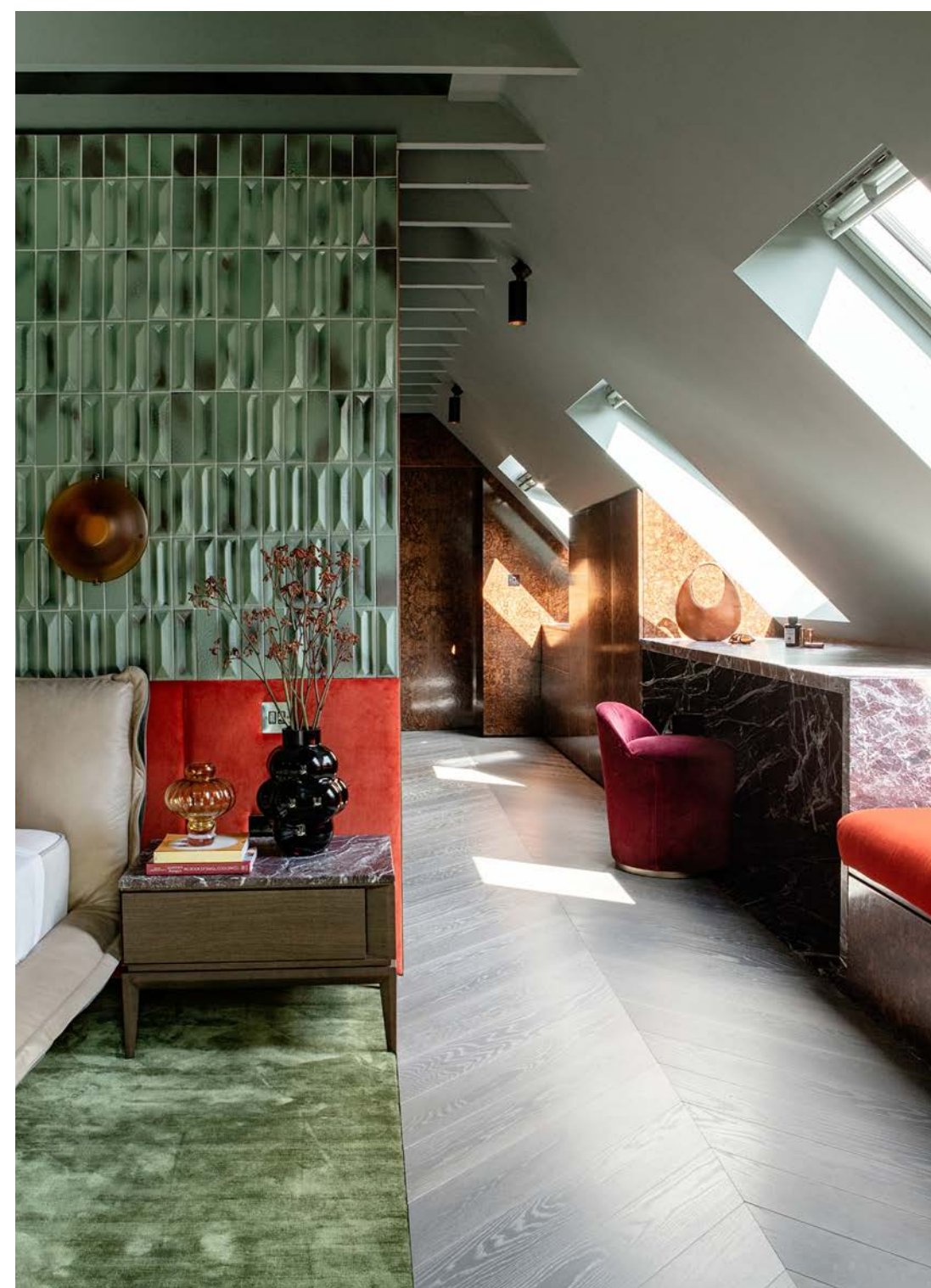
Væggen bag sengen er beklædt med fliser designet af arkitekten og designeren Gio Ponti. Den nedre del er beklædt med orange fløjlstof fra Designers Guild. Den overordnede tanke med sove-området var at skabe en stemning af nostalgi og en følelse af at træde ind i en anden æra. Den runde, ravfarvede væglampe er af Alberto Lago fra Artemest. Gulvtæppet er fra Jacaranda Carpets.