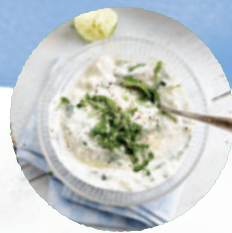
Een SAUS op basis van een plantaardig alternatief voor room