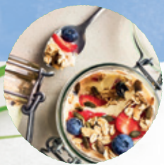
Je GRANOLA eten met een plantaardig alternatief voor yoghurt

Duurzaam eten is geen kwestie van alles of niets! Het is perfect mogelijk een voorstander van plantaardig te zijn, zonder producten van dierlijke oorsprong helemaal af te zweren.