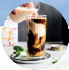
Een scheutje plantaardige drink in je KOFFIE