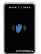
センサースイッチ