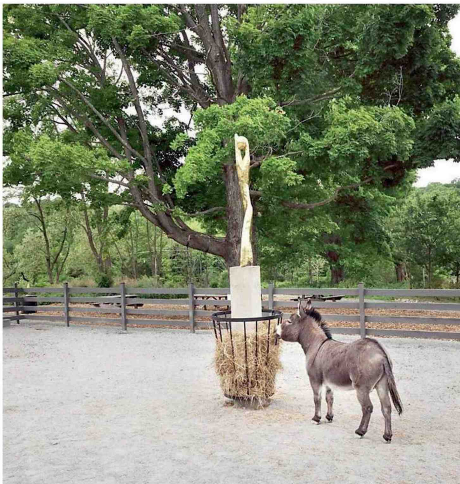
MAGAZZINO ORIGINALE MAMMAI SIDI L'AVI