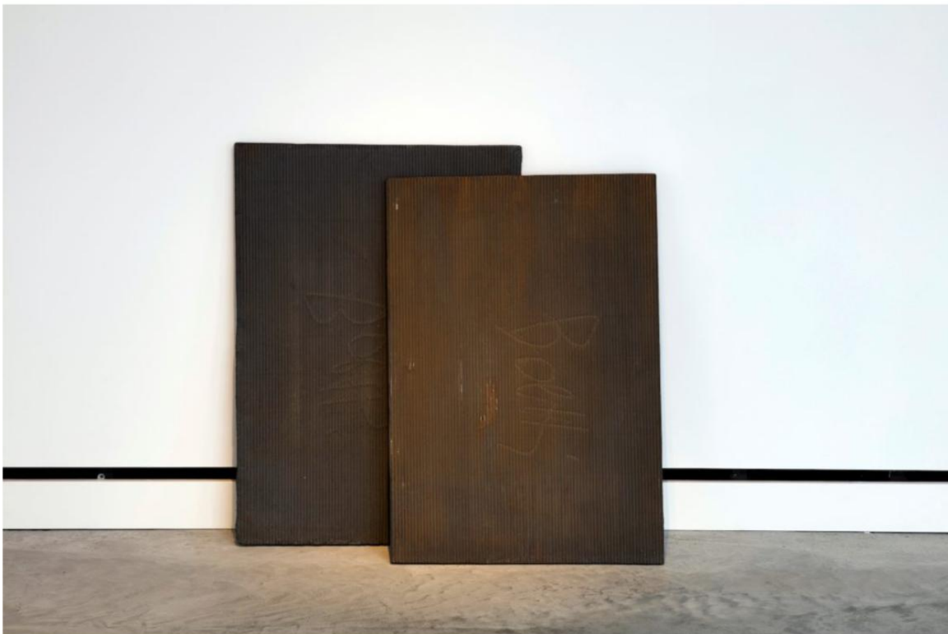
Alighiero Boetti, Ghise (Boetti), 1968. Cast Iron, 41 x 421_2 x 9 in. (104.1 x 108 x 22.9 cm) ©Alighiero Boetti by SIAE/ARS 2026

Tutto pronto per Tutto Boetti 1966 -1993 , la grande mostra che Magazzino Italian Art dedica ad Alighiero Boetti con un titolo che richiama l'idea di una presentazione ampia della ricerca dell'artista, lungo quasi tre decenni di attività, e che allude esplicitamente alla celebre serie dei Tutto , grandi composizioni tessili realizzate a partire dagli anni Ottanta e che accostano una fitta trama di immagini e segni.