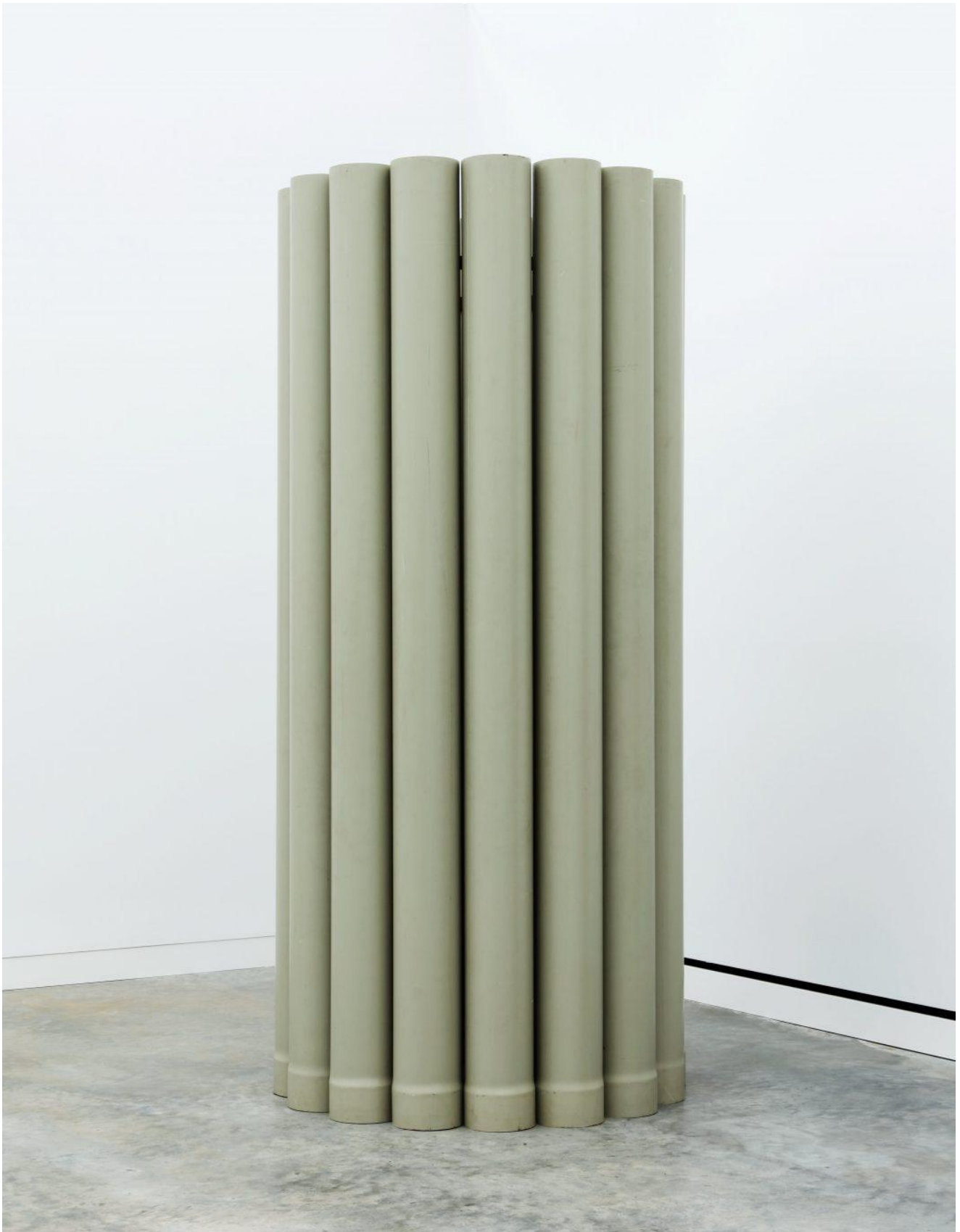
Alighiero Boetti, Mazzo di tubi, 1966. PVC pipes, 110 1_4 x 51 x 51 in. (280 x 130 x 130 cm). ©Alighiero Boetti by SIAE/ARS 2026

Insieme a Triplo metro , Asta di misurazione , Mancorrente a squadra , Pannello luminoso e Clino saranno esposte anche due grandi opere che sottolineano la dimensione scultorea della ricerca di Boetti negli anni della sua formazione. Pavimento luminoso (1966), struttura lignea