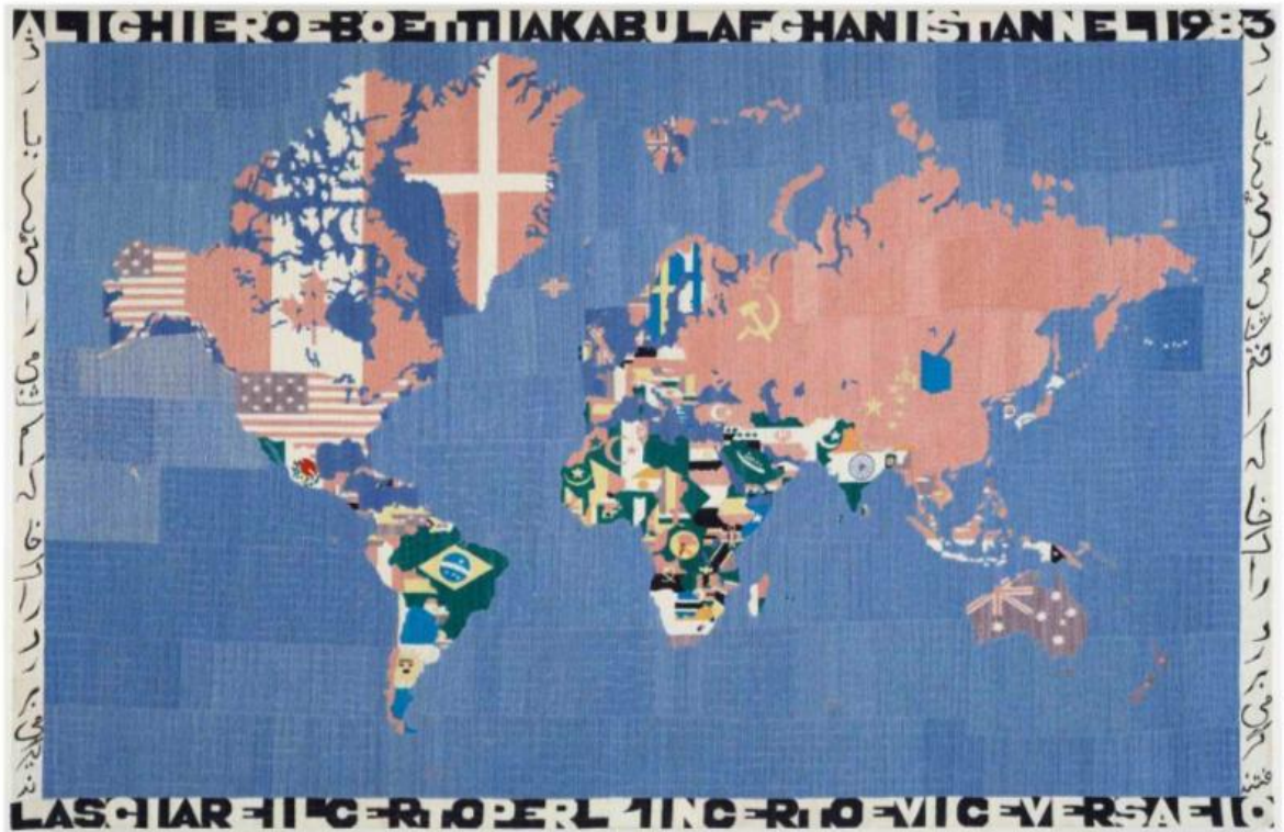
Alighiero Boetti, Mappa, 1983. Embroidery on fabric, 45 1_4 x 70 7_8 x 1 in. (115 x 180 x 2.5 cm). Courtesy of Magazzino Italian Art. Photo by Marco Anelli ©Alighiero Boetti by SIAE/ARS 2026

Nel percorso espositivo trovano posto anche una serie di opere rappresentative del lavoro di Boetti negli anni romani, quando la sua ricerca si espande in molteplici direzioni, insistendo sempre più sui temi della dualità, dell'autorialità e della delega dell'esecuzione. Esempio è Da mille a mille (1975), opera composta da undici fogli di carta millimetrata in cui gli assistenti dell'artista erano liberi di combinare i quadratini da colorare secondo scelte autonome che mette in discussione il tradizionale statuto dell'autore come espressione di una volontà singola, trasformando l'opera in un campo aperto in cui il risultato finale emerge dall'interazione tra regola e libertà.