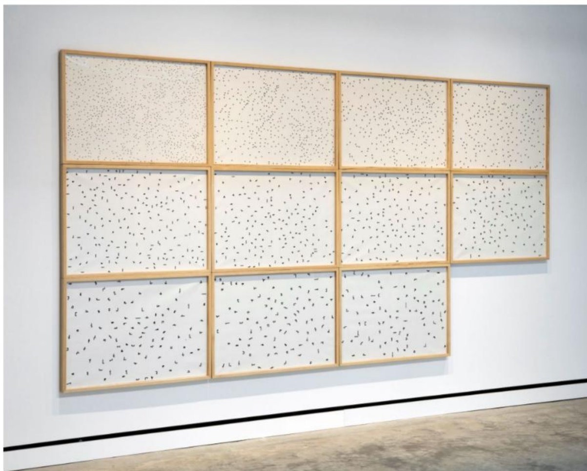
Alighiero Boetti, Da Mille a Mille, 1975. Black ball point pen in on graph paper, 88 1_2 x 166 x 2 1_8 in. (224.8 x 421.6 x 5.4). Courtesy of Magazzino Italian Art. Photo by Marco Anelli ©Alighiero Boetti by SIAE/ARS 2026

dipinta con un sistema di illuminazione nascosto al suo interno, e disposta a terra come una piattaforma, mette in discussione i confini tra oggetto, architettura e scultura, materializzando la luce all'interno di una forma geometrica essenziale. L'opera dialoga con il contesto culturale della Torino degli anni Sessanta, richiamando i pavimenti illuminati del Piper Club , luogo centrale della scena artistica e sperimentale frequentata dagli artisti dell'Arte Povera. Accanto a questa, Mazzo di tubi (1966) introduce un diverso tipo di intervento sulla materia industriale. L'opera è composta da sedici tubi in PVC assemblati verticalmente fino a evocare la forma ieratica di una colonna. Grazie alla riorganizzazione di elementi prefabbricati, Boetti ridefinisce la funzione e la percezione di oggetti solitamente nascosti negli spazi tecnici di un edificio. Questo gesto trasforma la composizione in una struttura spaziale autonoma, spostando l'attenzione dal fare manuale alla scelta, all'assemblaggio e alla ridefinizione del significato.