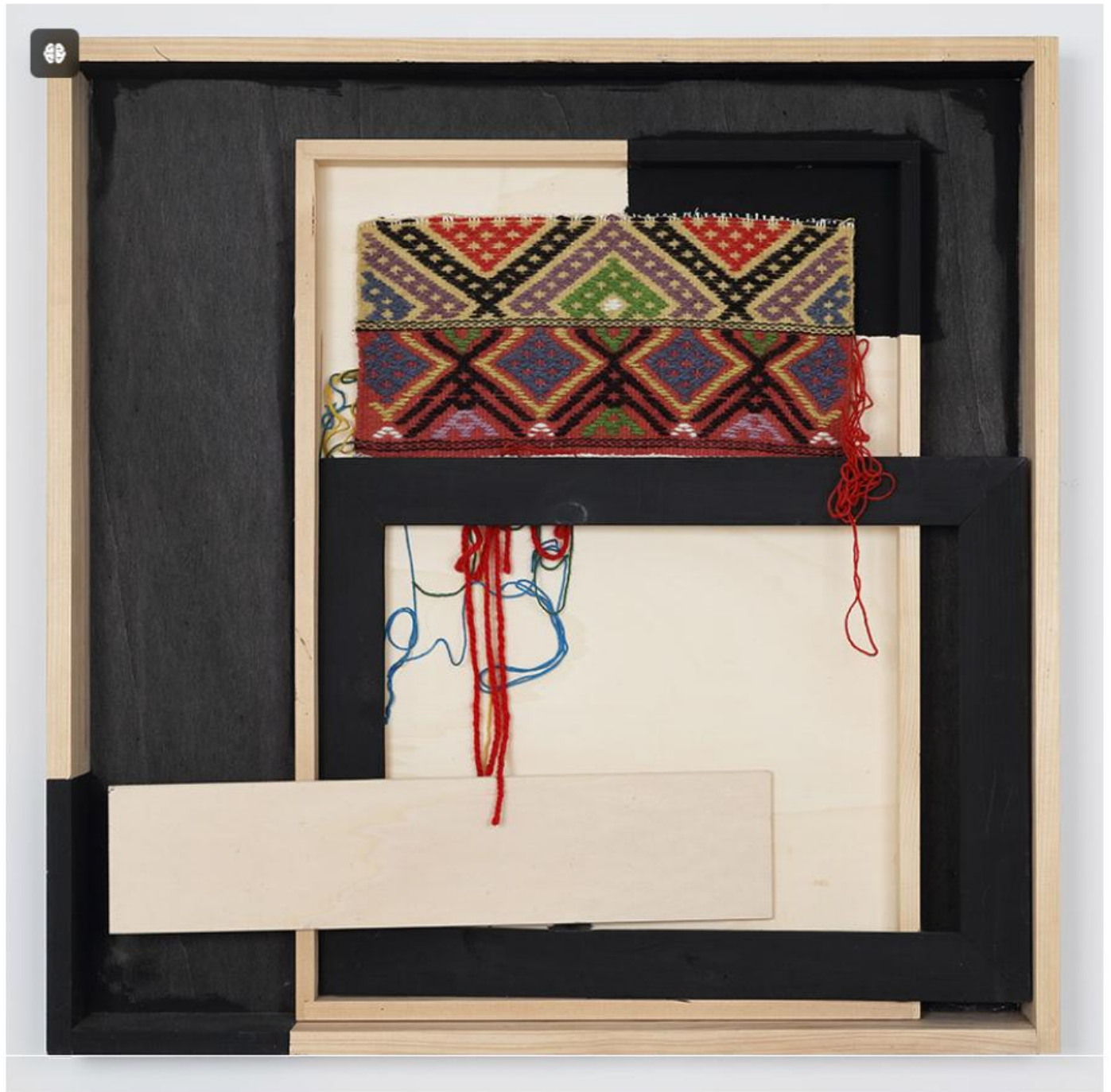
Maria Lai, Li trammi, 2006. Mixed media, 80 x 80 x 10 cm. Magazzino Italian Art Foundation. Photo by Marco Anelli. ©Archivio Maria Lai, by Siae 2024/Artists Rights Society (ARS)

direttore di Magazzino, che afferma che «Proprio come Maria Lai ha creato un ponte tra luoghi e culture nella sua arte, e nella sua iniziativa più celebre ha letteralmente legato un villaggio per unire la sua gente, così Magazzino crea un luogo singolare dove i visitatori possono incontrare la più grande arte dell'Italia del dopoguerra. Siamo eccezionalmente orgogliosi di poter offrire al nostro pubblico un'esperienza più ampia dell'arte italiana contemporanea, proponendo la prima retrospettiva nordamericana di questa straordinaria artista».