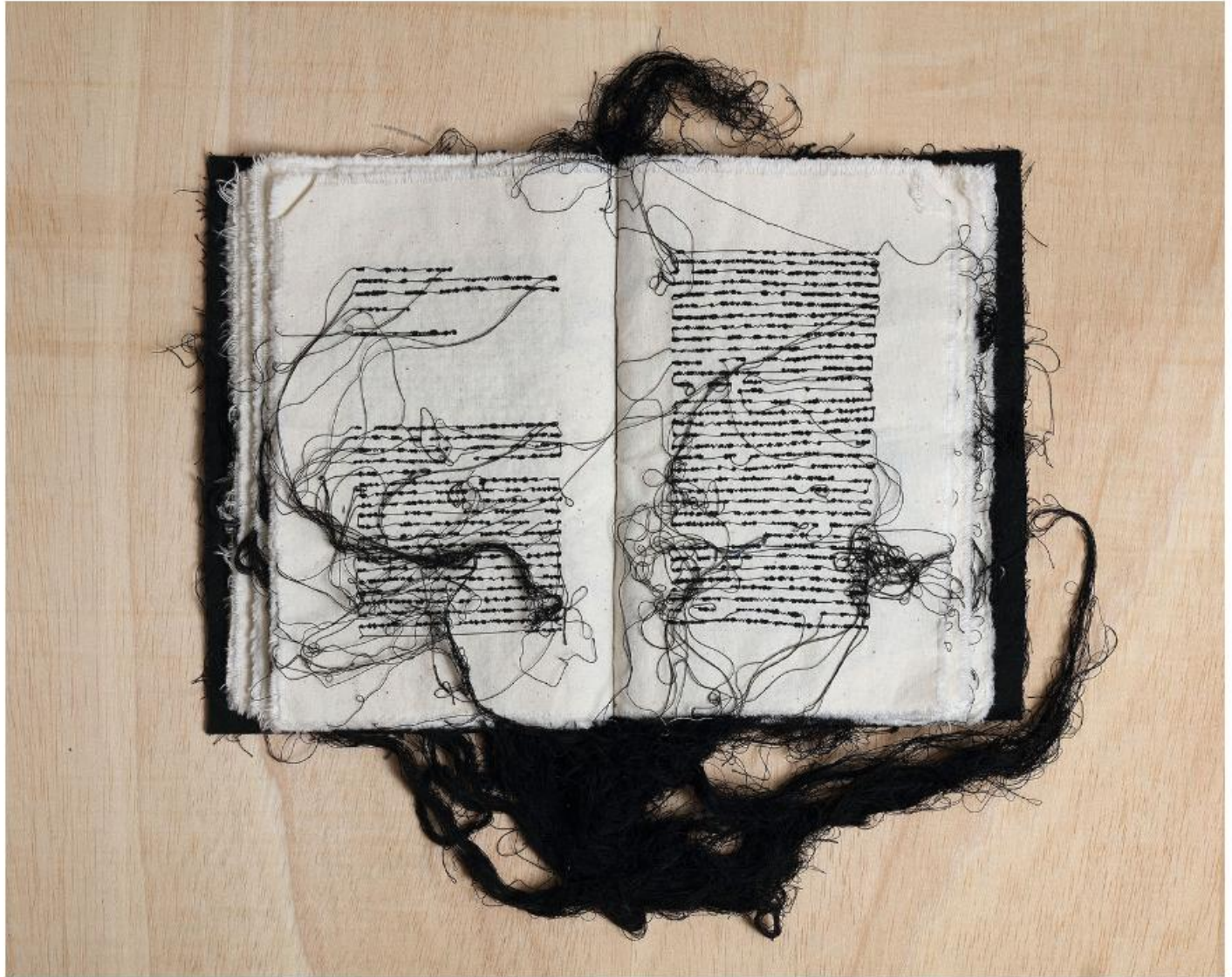
Maria Lai, Voce di infinite letture, 1992. Cotton thread, ink, canvas, 25 x 16 x 5 cm. Magazzino Italian Art Foundation.

di ascolto di Maria Lai che ha saputo restituire la parola a un intero paese e rendersi partecipe della memoria e dei fantasmi della gente comune, aiutandola a liberarsi della parte distruttiva di sé e ad aprirsi con disponibilità nuova al colloquio e alla solidarietà».