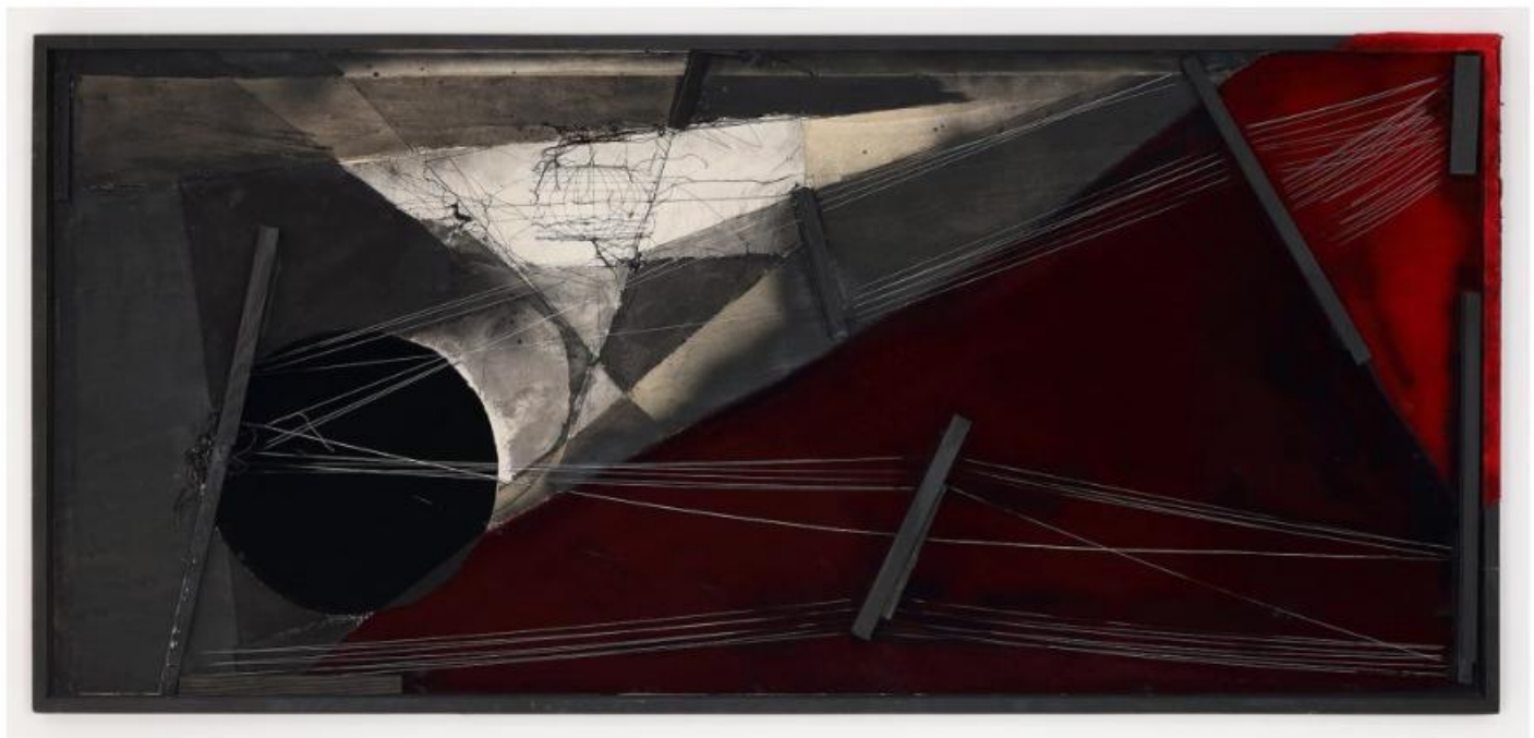
Maria Lai, Fili di vela spaziale, 2007. Nails, wood, thread, tempera, velvet, 186 x 88 x 4.5 cm. Magazzino Italian Art Foundation.

«Quando ci siamo imbattuti nel lavoro di Maria Lai, tre decenni fa, abbiamo capito subito che era essenziale per lo sviluppo dell'Arte Povera. Eppure, il suo ruolo è ancora poco riconosciuto. Impareggiabile tra i suoi colleghi nel perseguire una visione singolare, Lai ha portato avanti il suo mestiere con ingegno e determinazione», dichiarano Nancy Olnick e Giorgio Spanu . Maria Lai. A Journey to America non è solo una retrospettiva: è l'occasione per il pubblico americano di conoscere quell'artista che fu sempre capace di vedere nuovi mondi e modi di pensare.