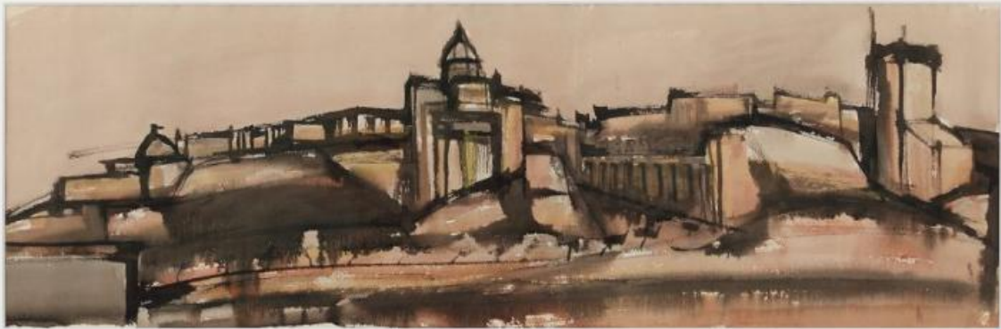
Maria Lai, Veduta di Cagliari, 1952. China acquarellata, 34 x 102 cm. Magazzino Italian Art Foundation. Photo by Marco Anelli. © Archivio Maria Lai, by Siae 2024/Artists Rights Society (ARS)

dove l'eccezionale collezione di Arte Povera del museo offrirà il contesto ideale per valorizzare il contributo unico di Maria Lai».