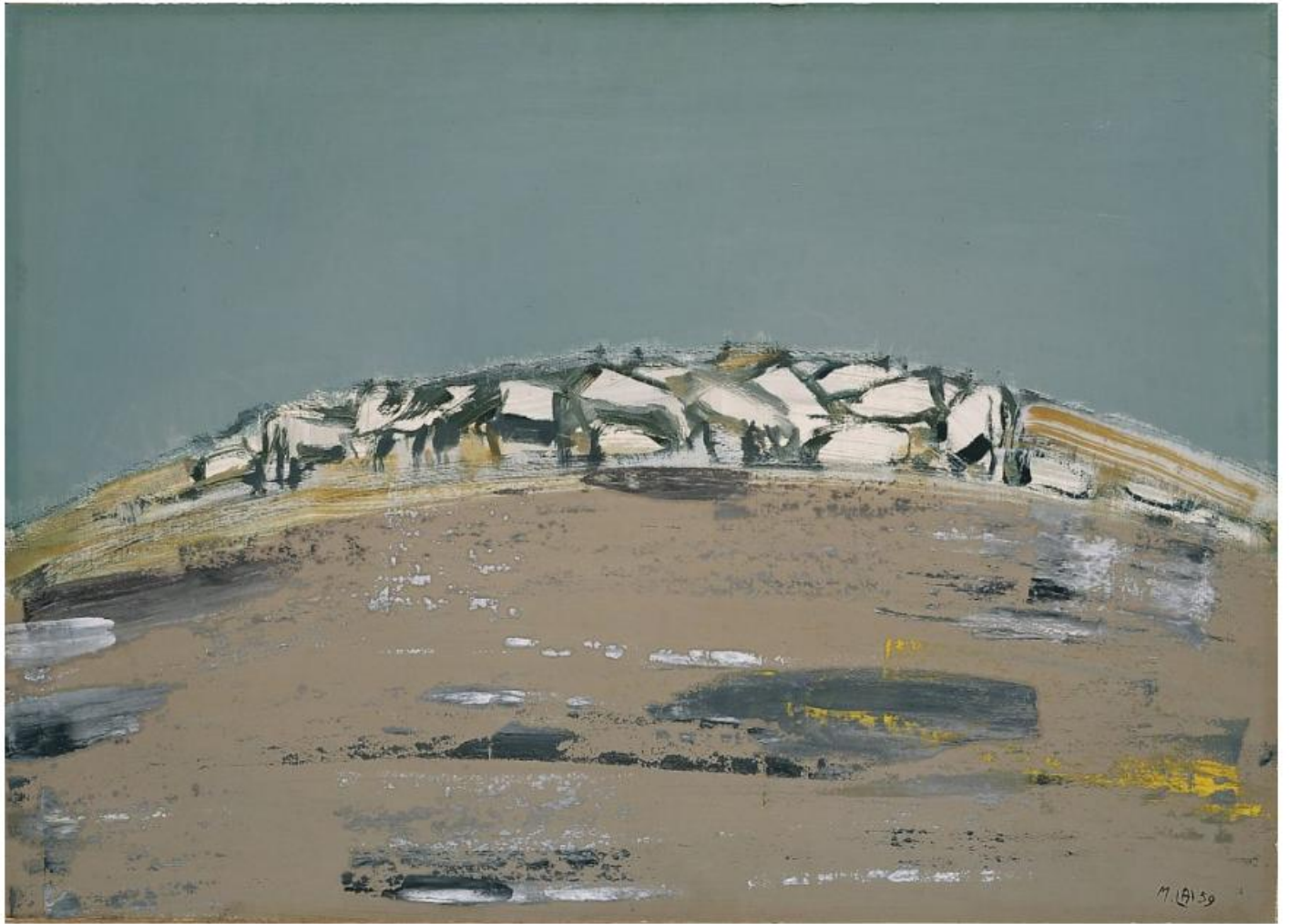
Maria Lai, Ovile, 1959. Mixed media on canvas, 50 x 70 cm. MAN – Museo d'arte della provincia di Nuoro. Photo by Confinivisivi, Pierluigi Dessì. © Archivio Maria Lai, by Siae 2024/Artists Rights Society (ARS)