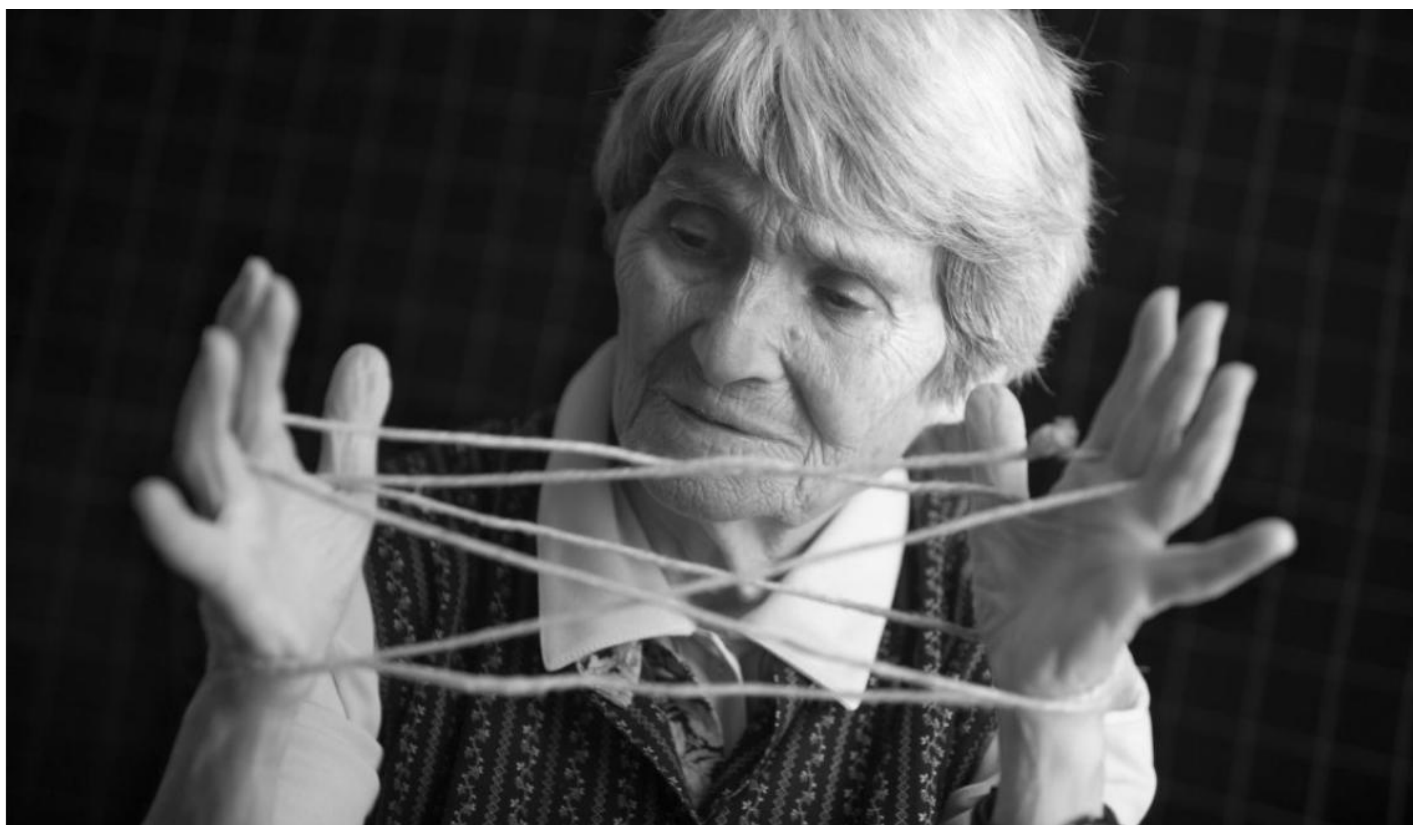
Maria Lai