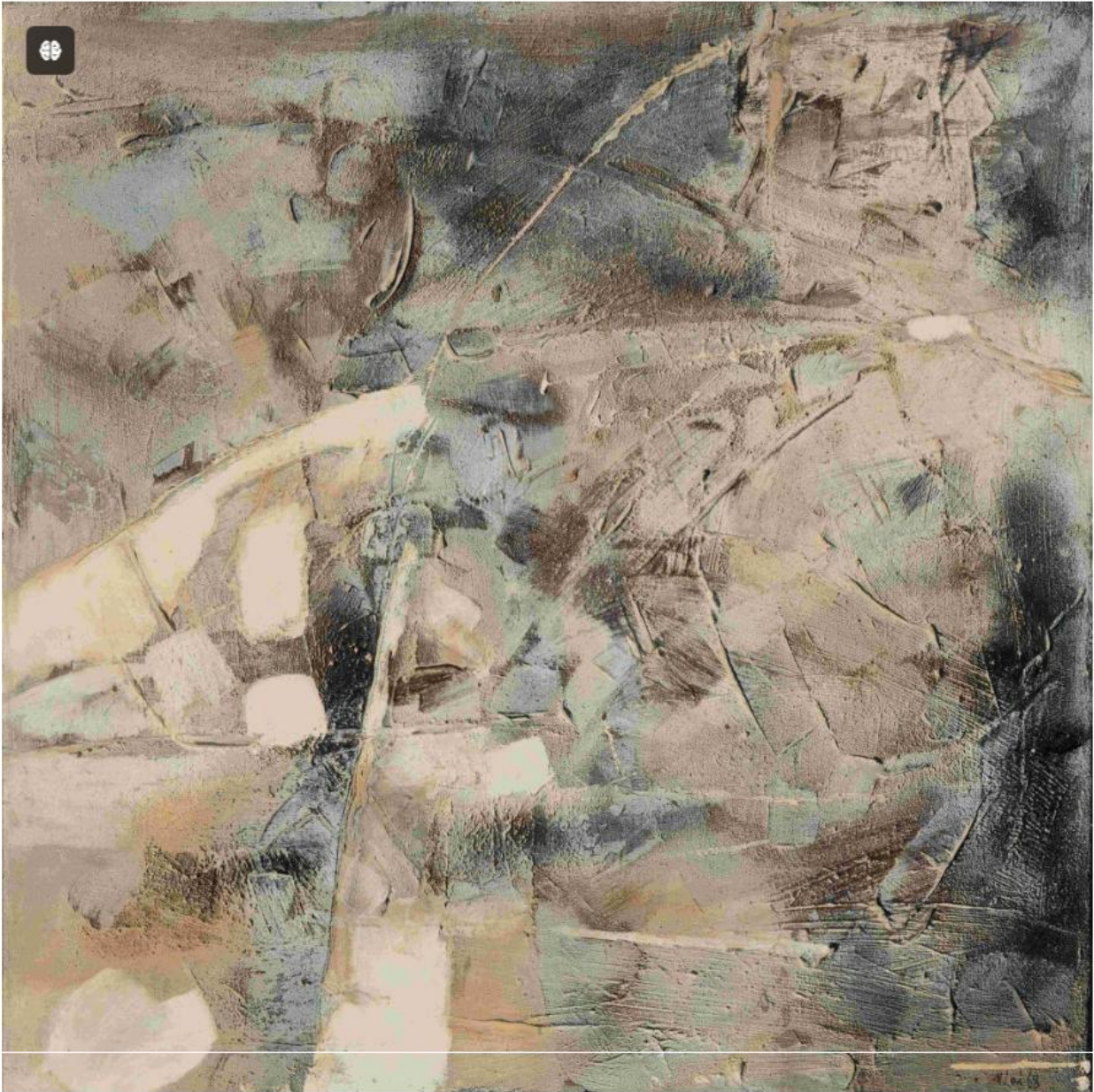
Maria Lai, Notturmo n.2, 1968. Oil or acrylic, mixed media on linen, 15 x 15 cm. Private Collection.

Lai, innamorata della poesia di Walt Whitman e conoscitrice della pittura di Jackson Pollock e Robert Rauschenberg, decide di visitare per la prima volta l'America nella primavera del 1968. Nel frattempo si era lasciata alle spalle la figurazione per abbracciare l'astrazione e si era allontanata dalla pittura e dal disegno per orientarsi verso una ricerca più radicale, con cui diede vita a un linguaggio artistico innovativo. Di ritorno dagli Stati Uniti, dove si spinge fino all'Ontario sviluppando un forte interesse per le culture visive dei nativi americani, Lai trova il coraggio di presentare i risultati delle sue sperimentazioni alla Biennale di Bolzano nel 1969 e alla Galleria Schneider di Roma nel 1971: qui, nel mentre dava vita alla serie forse più nota nella sua produzione, ispirata agli strumenti utilizzati storicamente dalle donne della Sardegna per creare