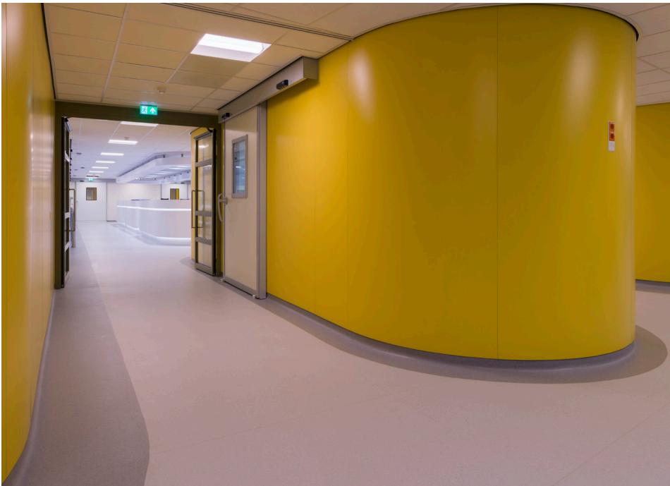
03 Ruime opzet voor toegankelijkheid, veiligheid en duurzaamheid.