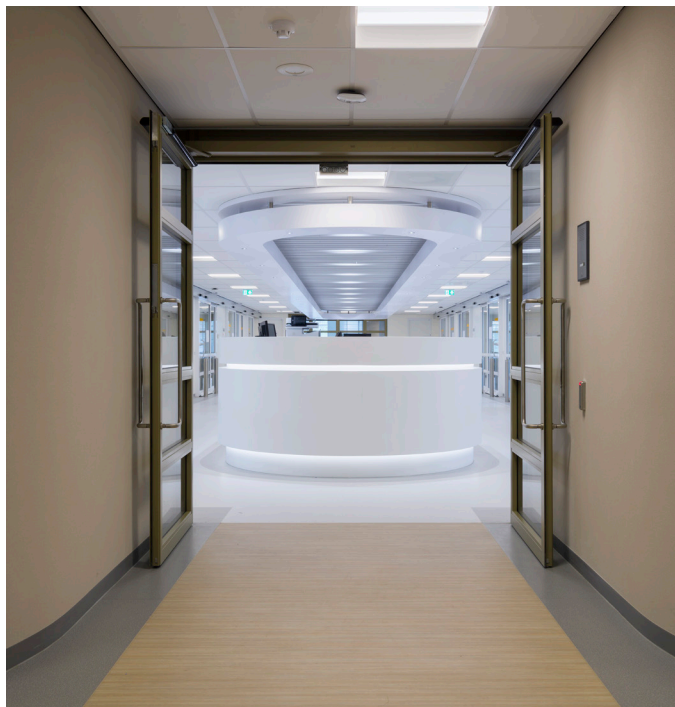
02 Moderne oplossingen voor toegankelijkheid zonder barrières.