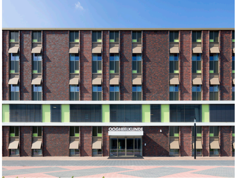
02 Toepassing van automatische deuren, brandwerende deuren, deurdrangers en anti-panieksloten door het hele ziekenhuis heen.