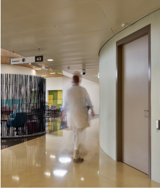
01 Moeiteloze toegang voor patiënten, bezoekers en medewerkers – dankzij dormakaba.