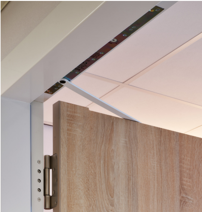
01 Vrijwel onzichtbare deurdrangers in vele deuren toegepast.