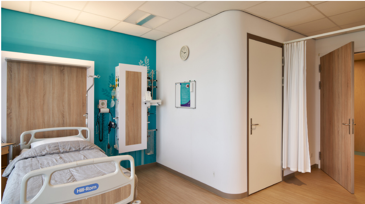
01 Moderne, toegankelijke patiëntenkamers en behandelruimtes.