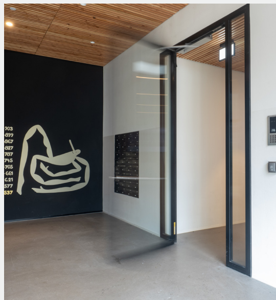
Afbeelding 2: automatische draaideur bij de liftruimte