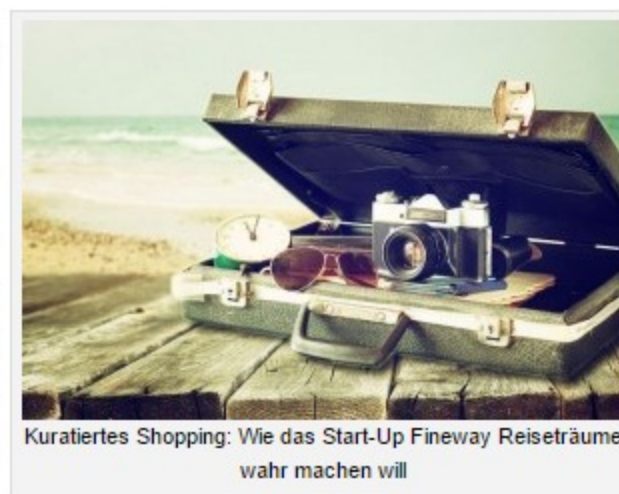
Kuratiertes Shopping: Wie das Start-Up Fineway Reiseträume wahr machen will

Solche individuellen Reisen bietet das Start-Up aus München seit Oktober 2015 an, während die Gründung ein Jahr zuvor stattfand. Das Team ist in dieser Zeit auf 15 Mitarbeiter angewachsen, von denen die meisten den Kunden bei der Urlaubsplanung beratend zur Seite stehen.