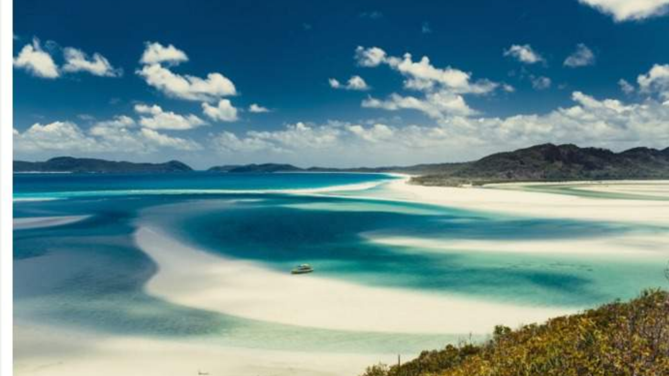
Wunderschönes smaragdgrünes Wasser und ein weißer Sandstrand