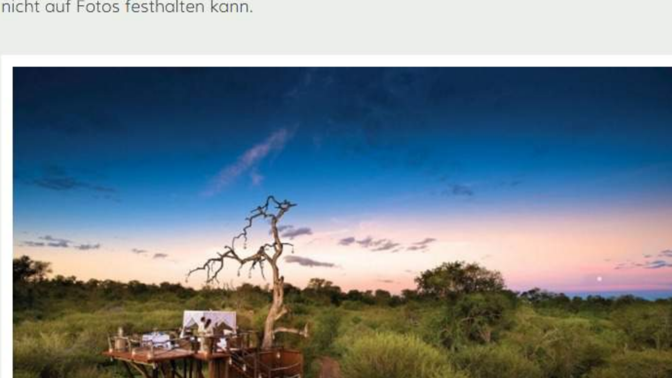
Ivory Lodge, Lion Sands Game Reserve Südafrika

Markus Feigelbinder: Einer der unvergesslichsten Erlebnisse war ein mehrtägiges Trekking im laotischen Regenwald vor über 10 Jahren. Jede Nacht haben wir in Dörfern ohne Strom oder fließend Wasser geschlafen, für die ein westlicher Reisender etwas völlig Unbekanntes war. Und sobald die Kerze des Dorfhauptlings abgebrannt war, war es auch Zeit zum Schlafen. Eine Gastfreundschaft, die man nicht auf Fotos festhalten kann.