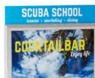
Barre Small A1