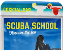
Balk ronde hoeken AO