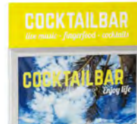
Balk large A1