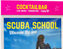
Balk large AO