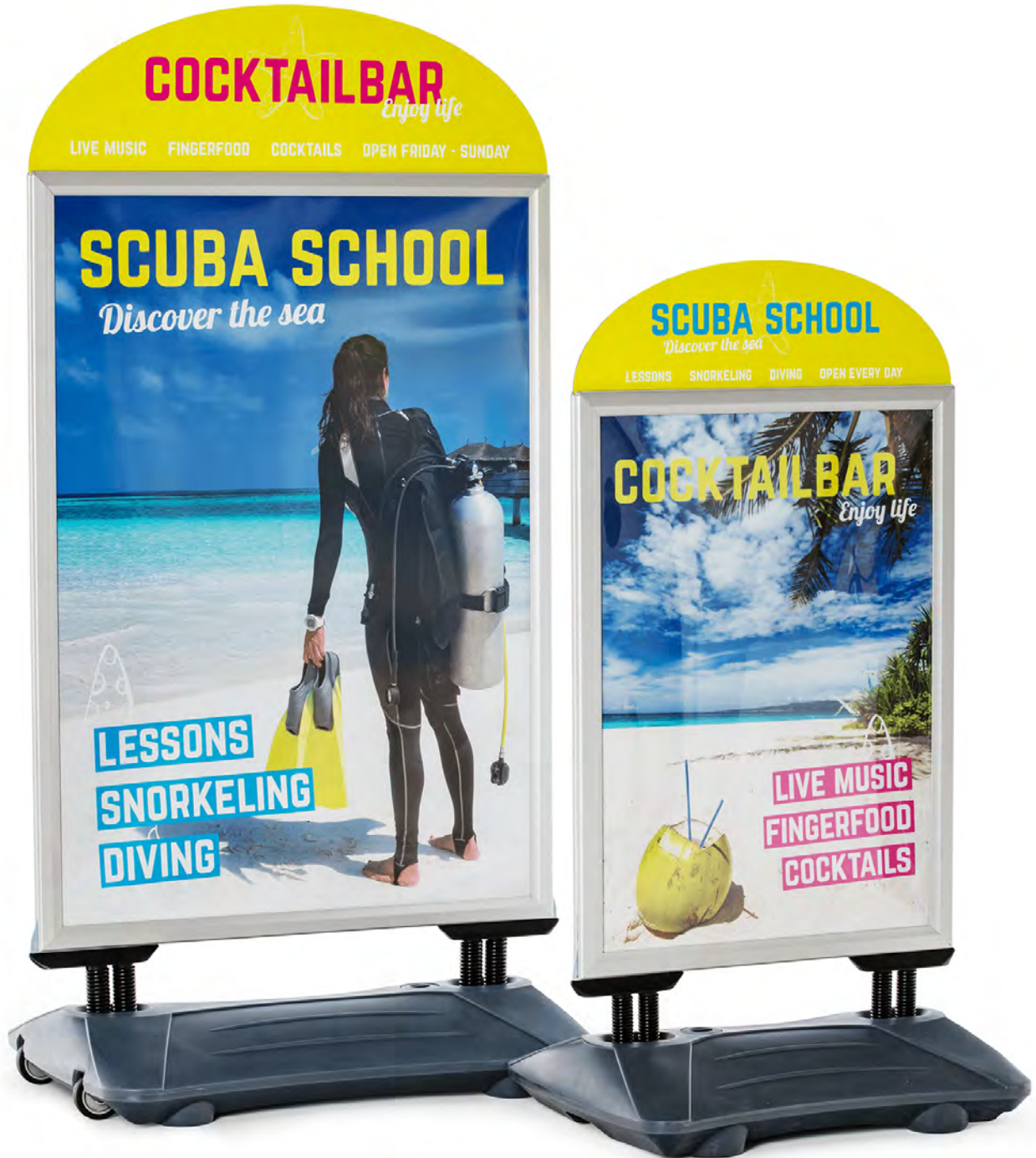
Tableau additionnel pour stop trottoir