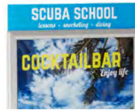
Balk small A1