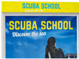
Balk small AO