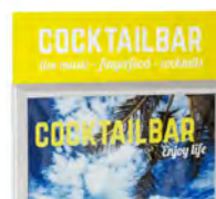
Barre Large A1