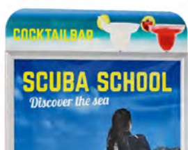
Barre coins arrondis AO