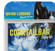
Balk ronde hoeken A1