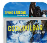
Barre coins arrondis A1