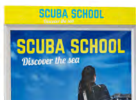
Barre Small AO