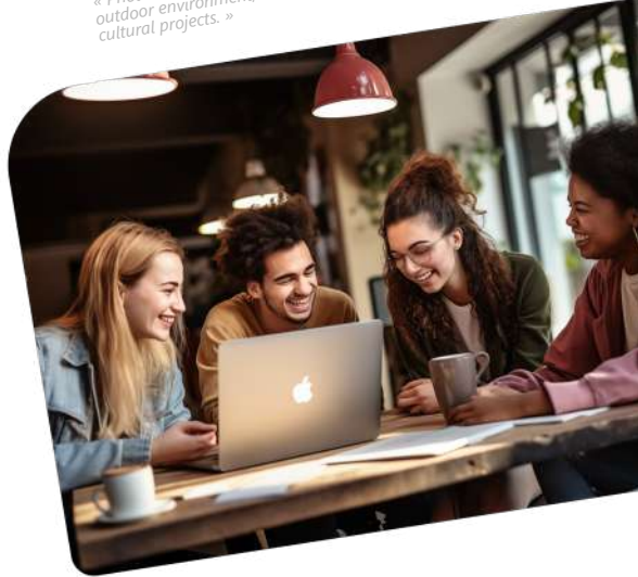
Image générée par Midjourney, avec la consigne (prompt) : « Photorealistic portrait of a man and a woman in an office or outdoor environment, seen in front view, working on art and cultural projects. »

Cette démarche permet de renforcer le sentiment d'appartenance des collaborateurs et de les inspirer en leur montrant comment leurs compétences professionnelles peuvent être mises au service de causes plus grandes.