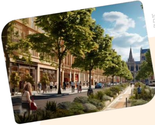
Image générée par Midjourney, avec la consigne : « Picture today's city of Dijon with lots of young and small trees that have just been replanted to bring welfare, peace and freshness to the urban citizens. »