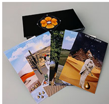
Ancestral Healing , tarotkort © Elia diane Fushi Bekene,