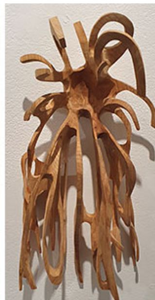
Rotsäck i hagtorn

Cowgirl Gallery, Malmö | Galleri Ping-Pong, Malmö | Galerie Leger, Malmö | Skånes konstförenings galleri | Celsius Projects, Malmö | Rostrum, Malmö | Omkonsts startside