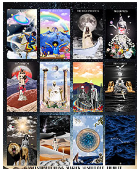
Ancestral Healing, tarotkort