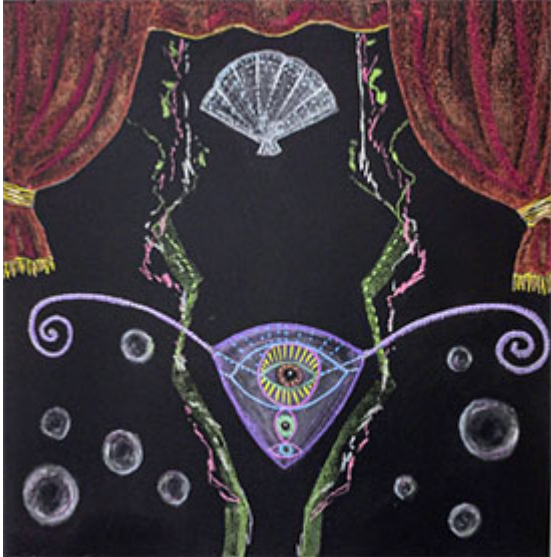
Järmdansen (Klicka på bilden för hög upplösning)