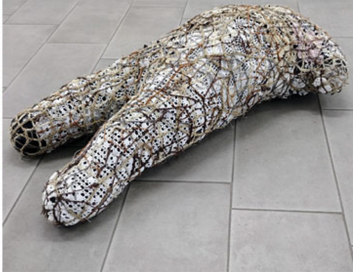
Will Not Be No More © Leif Holmstrand (Klicka på bilden för hög upplösning)

En gallerirunda i Malmö ett tiotal dagar in i november får mig att glömma världens dåliga nyheter en stund. Det är som om det pågår ett slags återförtrollning av konstvärlden. De just nu aktuella utställningarna fylls av önskan om en ljusare tillvaro, mer energi och inre styrka. Färgkraft och närheten till andliga världar ställer förunderliga frågor och blir till en andhämtning i den ljumma hösten.