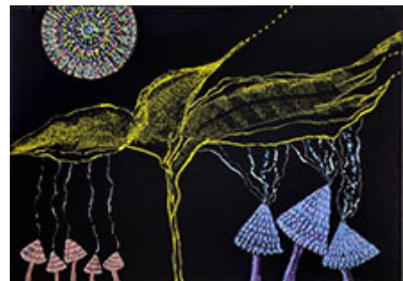
Silverdansen © Madeleine Aleman

Jag hittar några rader i hans senaste diktsamling "Inte världen" som kan gälla för båda konstnärerna: "halvopaka tankepunkter / ganska breda streck av konstigt tusch / svingar de mot gruppens ankomst / sprider ljuspigment och cirklar..."