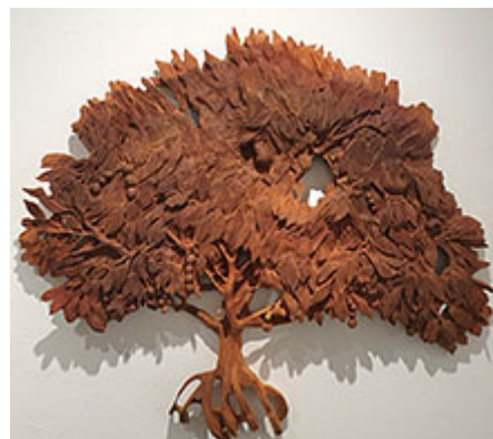
Bön och körsbär