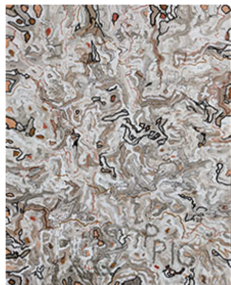
Pig © Leif Holmstrand