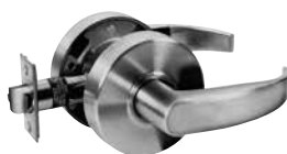
NON VERRUILLABLE VESTIBULE/PLACARD