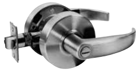
PRIVACY RESTROOM INSIDE PUSH BUTTON