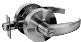
VERROUILLABLE SALLE DE BAINS BOUTON POUSSOIR INTÉRIEUR