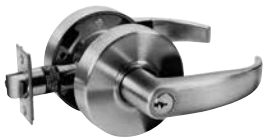
ENTRY ENTRANCE/OFFICE INSIDE TURN BUTTON