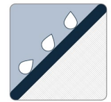
PROTECTION CONTRE L'ÉROSION

Le géotextile MIRAFI MD FW404 est composé de fils de polypropylène monofilament à haute ténacité, qui sont tissés en un réseau stable de sorte que les fils conservent leur position relative. Le géotextile MIRAFI FW404 est inerte à la dégradation biologique et résiste aux produits chimiques, aux alcalis et aux acides présents dans la nature.