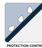
PROTECTION CONTRE L'ÉROSION

Le géotextile MIRAFI MD FW300 est composé de fils de polypropylène monofilament et fibrillés à haute ténacité, qui sont tissés en un réseau stable de sorte que les fils conservent leur position relative. Le géotextile MIRAFI FW300 est inerte à la dégradation biologique et résiste aux produits chimiques, aux alcalis et aux acides présents dans la nature.