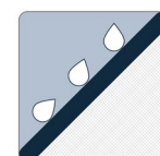
PROTECTION CONTRE L'ÉROSION

Le géotextile MIRAFI MD FW500 est composé de fils de polypropylène monofilament et fibrillés à haute ténacité, qui sont tissés en un réseau stable de sorte que les fils conservent leur position relative. Le géotextile MIRAFI FW500 est inerte à la dégradation biologique et résiste aux produits chimiques, aux alcalis et aux acides présents dans la nature.