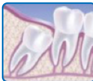
Impactación ósea angular del tercer molar (muela del juicio).