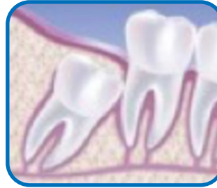
Sự chèn góc hàm và xương của răng hàm thứ ba (răng khôn)