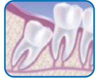
Sự co mô mềm của răng hàm thứ ba.