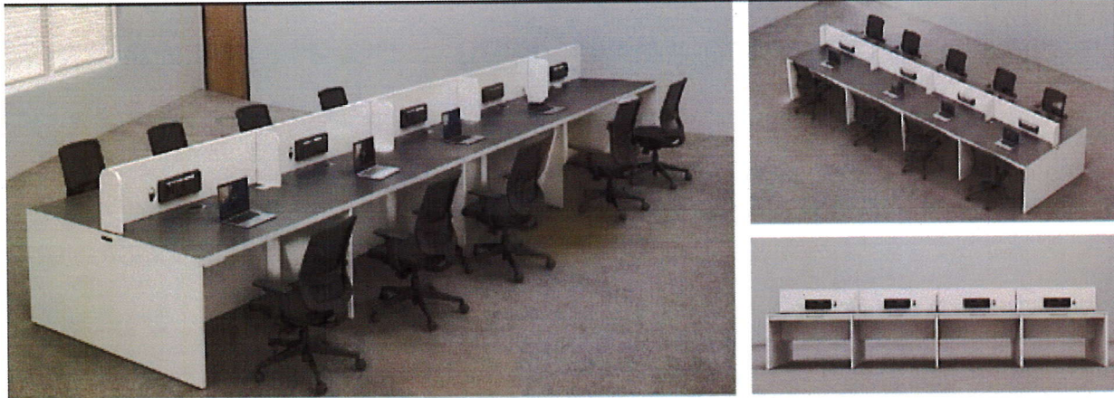
IT ROOM SETUP opt-2 SCALE 1:100