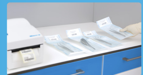
✓ Identificazione con MELAprint 80