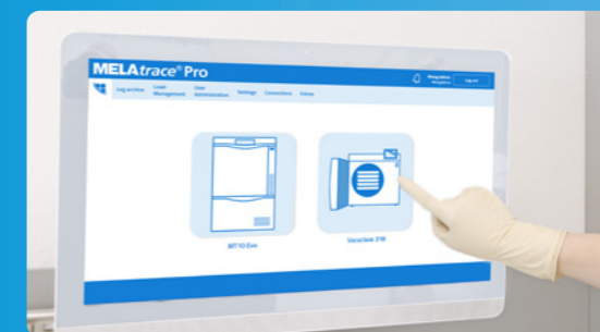
✓ Documentazione e rilascio con MELAttrace