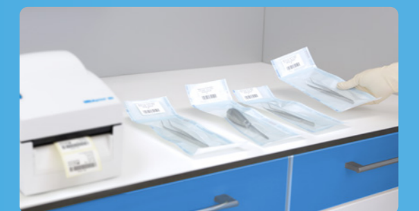
✓ Etiquetado con MELAprint 80