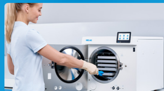
✓ Esterilización a vapor con Vacuclave