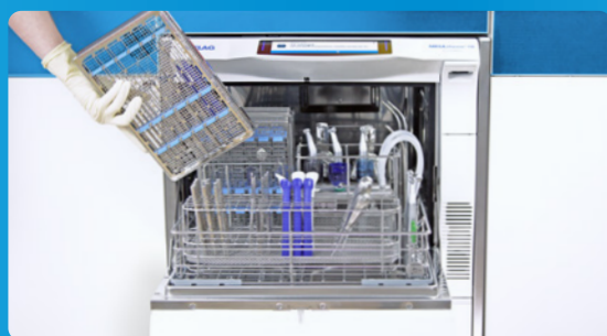
✓ Limpieza y desinfección con MELAtherm