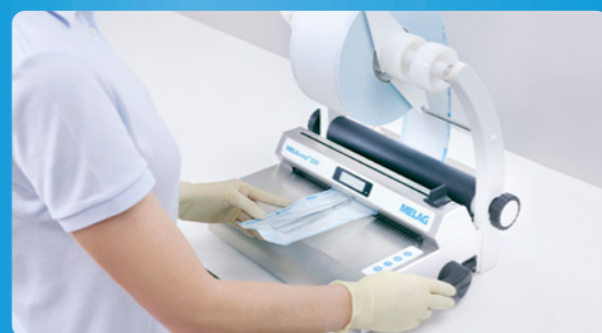
✓ Embolsado con MELAseal o MELAstora