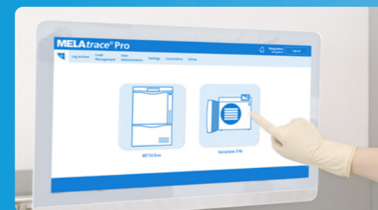
✓ Documentación y liberación con MELAtrace