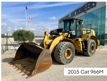
2015 Cat 966M