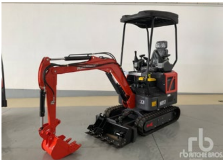
SIN Usar – 1/4 – 2024 Plus Power HE17