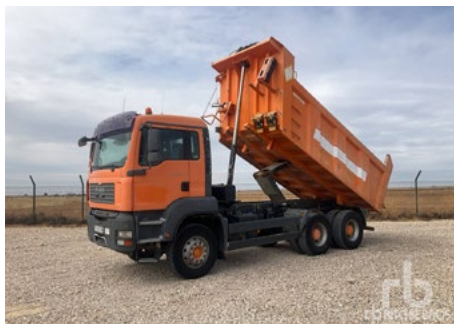
MAN TGA33.360 6x4