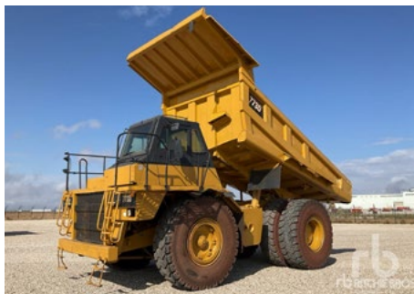
1/2 - Cat 773D