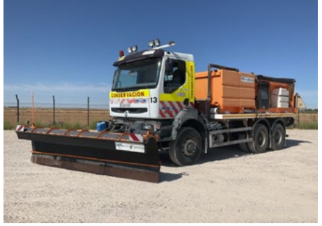
Renault Premium 370 6x6