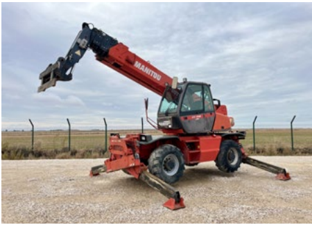
2005 Manitou MRT 2150