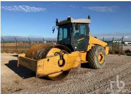
1/2 - Lebrero RAH X6