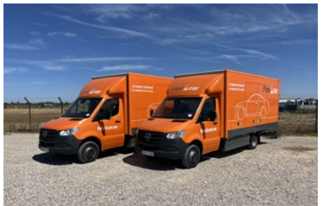
2/3 – 2022 & 2019 Mercedes-Benz Sprinter 4x2