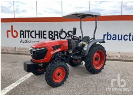
SIN Usar – 1/5–2024 Plus Power TT604