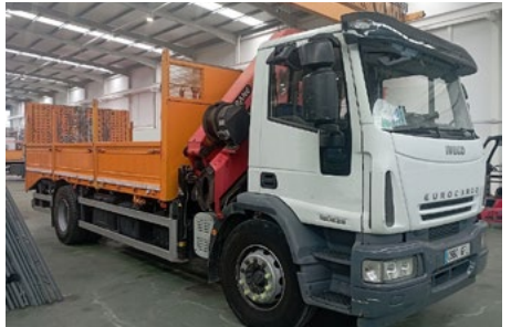
Iveco Eurocargo 280 4x2 W-Palfinger PK16502