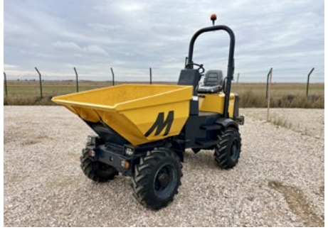
2018 Mecalac TA2SH Swivel