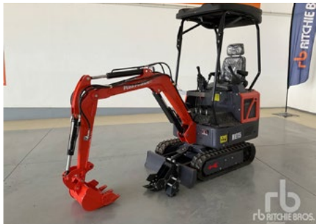
SIN Usar – 1/5 – 2024 Plus Power HE15