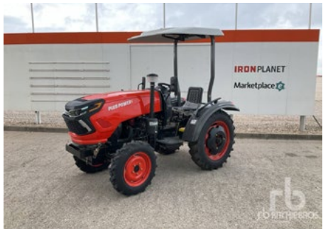
SIN Usar – 1/6 – 2024 Plus Power TT254