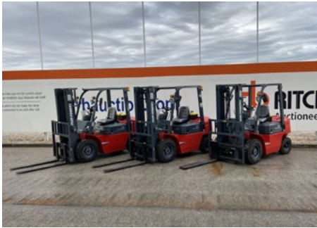
SIN Usar – 1/5 – 2024 Plus Power Vtdd-25