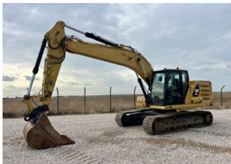
2018 Cat 320