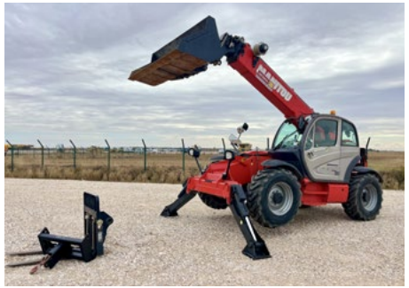
2017 Manitou MT1440