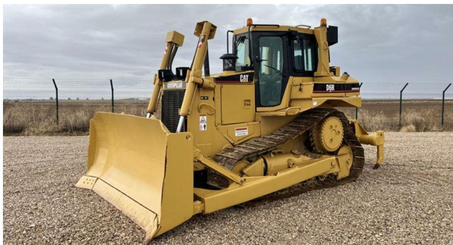
Cat D6R III