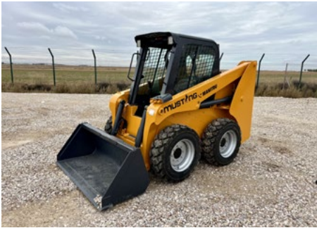
2018 Mustang 1500R