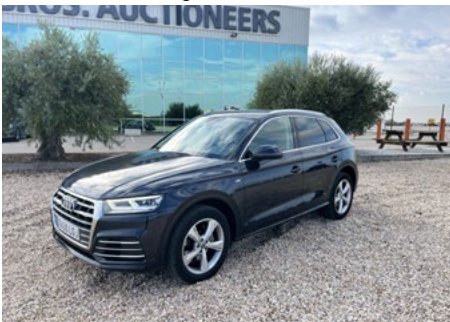
2020 Audi Q5 40TDI S-Line