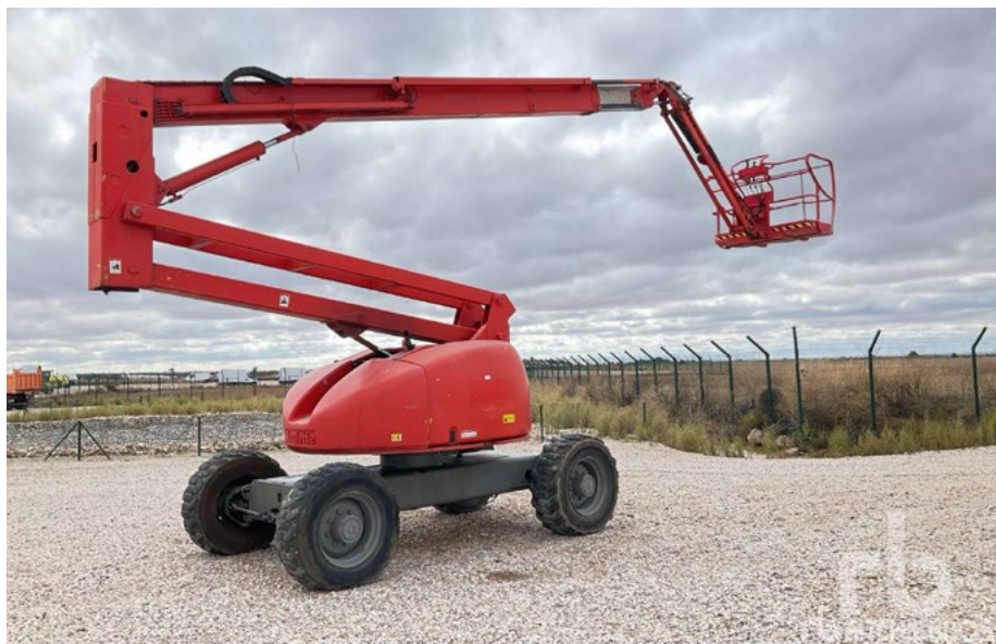
1/3 – Haulotte HA20PX 4WD