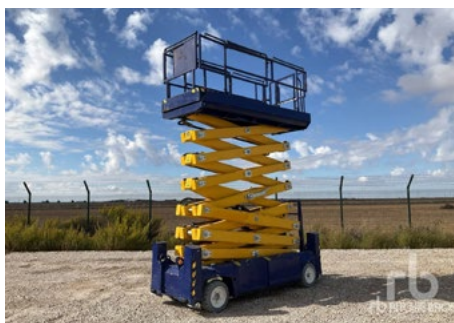
1/2 – 2016 PB S171-12ES