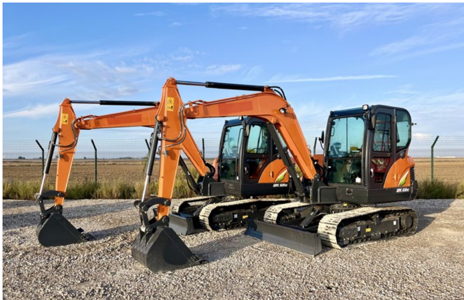
SIN Usar – 2/5 – 2024 Develon DX60E-10N