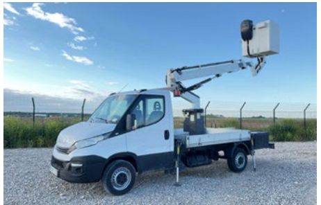
1/2 – 2017 Iveco 35S14N 4x2 W-2017 Movex TL13