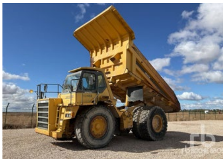
1/2 - Komatsu HD4655