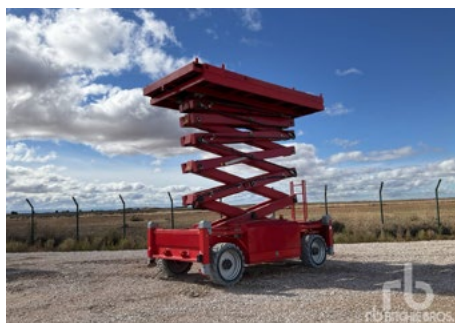
2017 PB S225-24DX 4x4