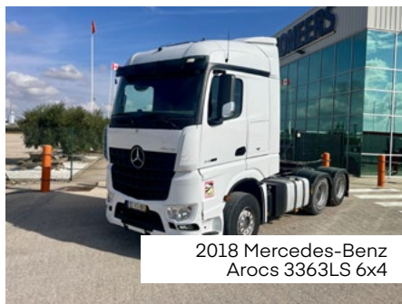
2018 Mercedes-Benz Arocs 3363LS 6x4