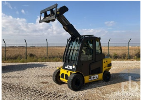
2013 JCB TLT35D