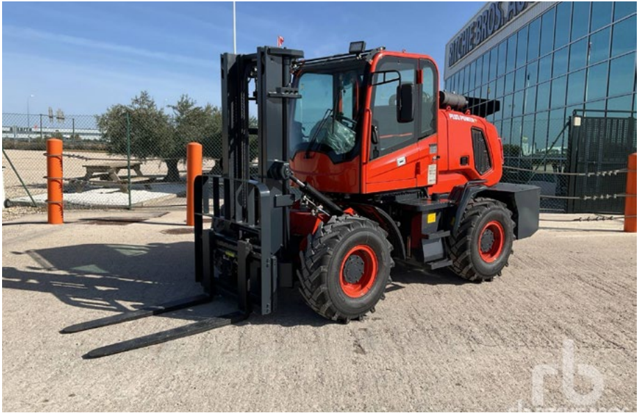
SIN Usar – 1/3 – 2024 Plus Power T30A1 4x4