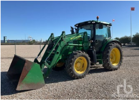
John Deere 6105R