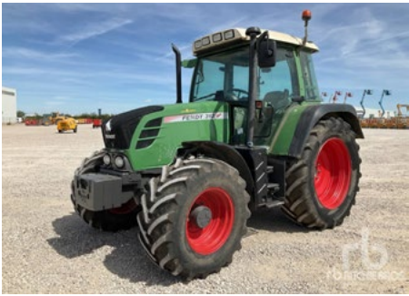
2015 Fendt 312V