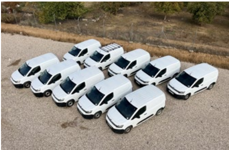
MAS DE 40–2021, 2020 & 2019 Citroen Berlingo Bluehdi 4x2