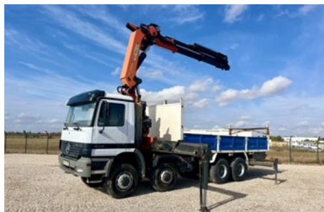
Mercedes-Benz Actros 4143AK 8x8 W/ Palfinger PK4402