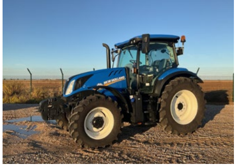
2023 New Holland T6.145