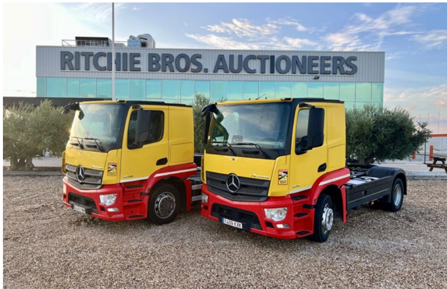
2 – 2019 Mercedes-Benz Actros 1846lnr 4x2