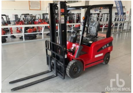
SIN Usar – 1/4 – 2024 Plus Power VTE15