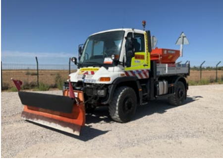
Mercedes-Benz Unimog 400/36 4x4