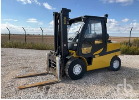
2016 Yale GLP50VX