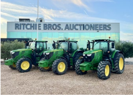
3/4 – 2019 & 2018 John Deere 6215R