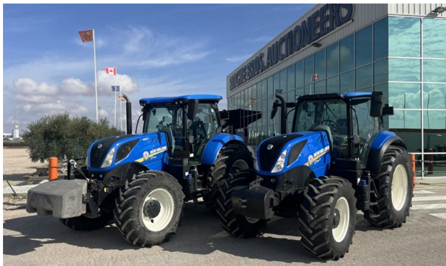
2016 New Holland T7-245 & 2023 New Holland T7.165S