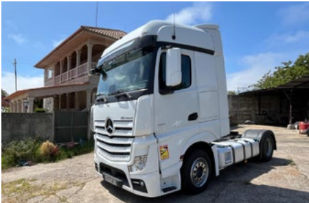
1/2 – 2021 & 2018 – Mercedes-Benz Actros 1851 & 3363 4x2