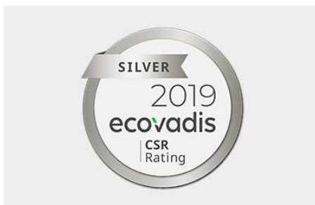
EcoVadis Silver Rating

www.mercateo.com/corporate/presselounge/pressemitteilungen/