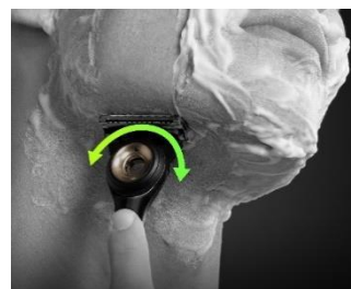
▼フレックスディスク

フレックスディスクにより、あごの下のような剃りづらい部分も含めた顔の輪郭にフィットし、剃るたびに快適な剃り心地と、剃り残しゼロへ。