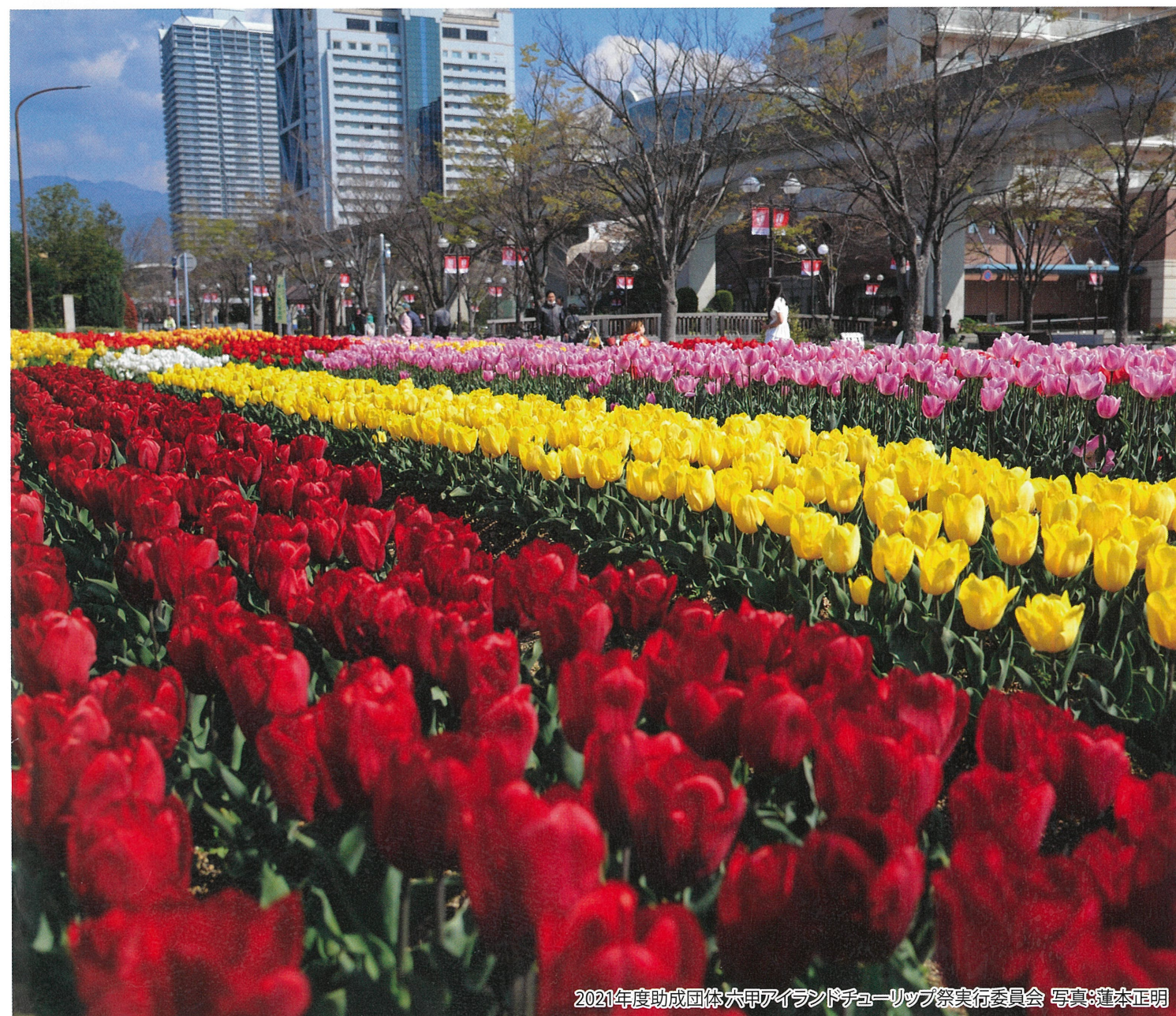
2021年度助成団体 六甲アイランドチューリップ祭実行委員会