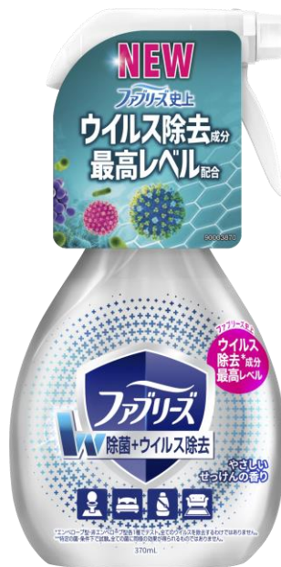
「ファブリーズ W除菌+ウイルス除去*2 最高レベル」

P & G ジャパン (本社: 神戸市) は、エアケアブランド「ファブリーズ」より「ファブリーズ W 除菌+ウイルス除去*2 最高レベル」を、2021 年 10 月 下旬より全国で新発売いたします。