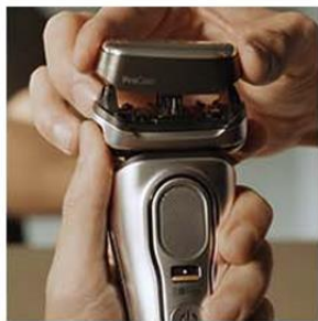
2. 美顔器ヘッドを取り付ける。