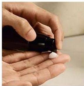
3. 化粧水等のスキンケア製品を肌に塗布する。 どの化粧水でも使用可能。