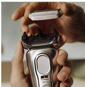
1. シェービングヘッドを取り外す。