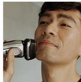
4. スキンケア製品の上から、美顔器ヘッドを当てる。