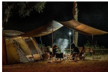
▲キャンプやアウトドアの最中にも