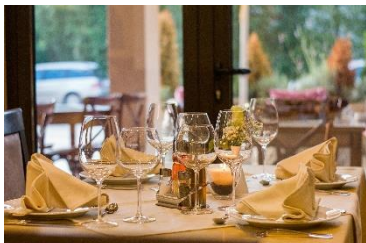
▲夕方・旅行・出張先、人と会う前にも