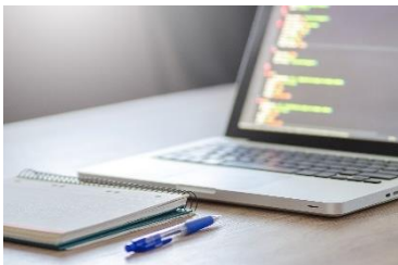
▲オンライン会議前や小休止などの隙間時間に

BRAUN mini は軽量小型ながらパワフルな剃り味でしっかり剃れるため、商談前や夕食前に限らず、デスク周りに置いてオンライン会議前の隙間時間に使用したり、移動中の車の中や出張中・旅行中、キャンプやアウトドアの最中など、様々なシーンで活躍します。