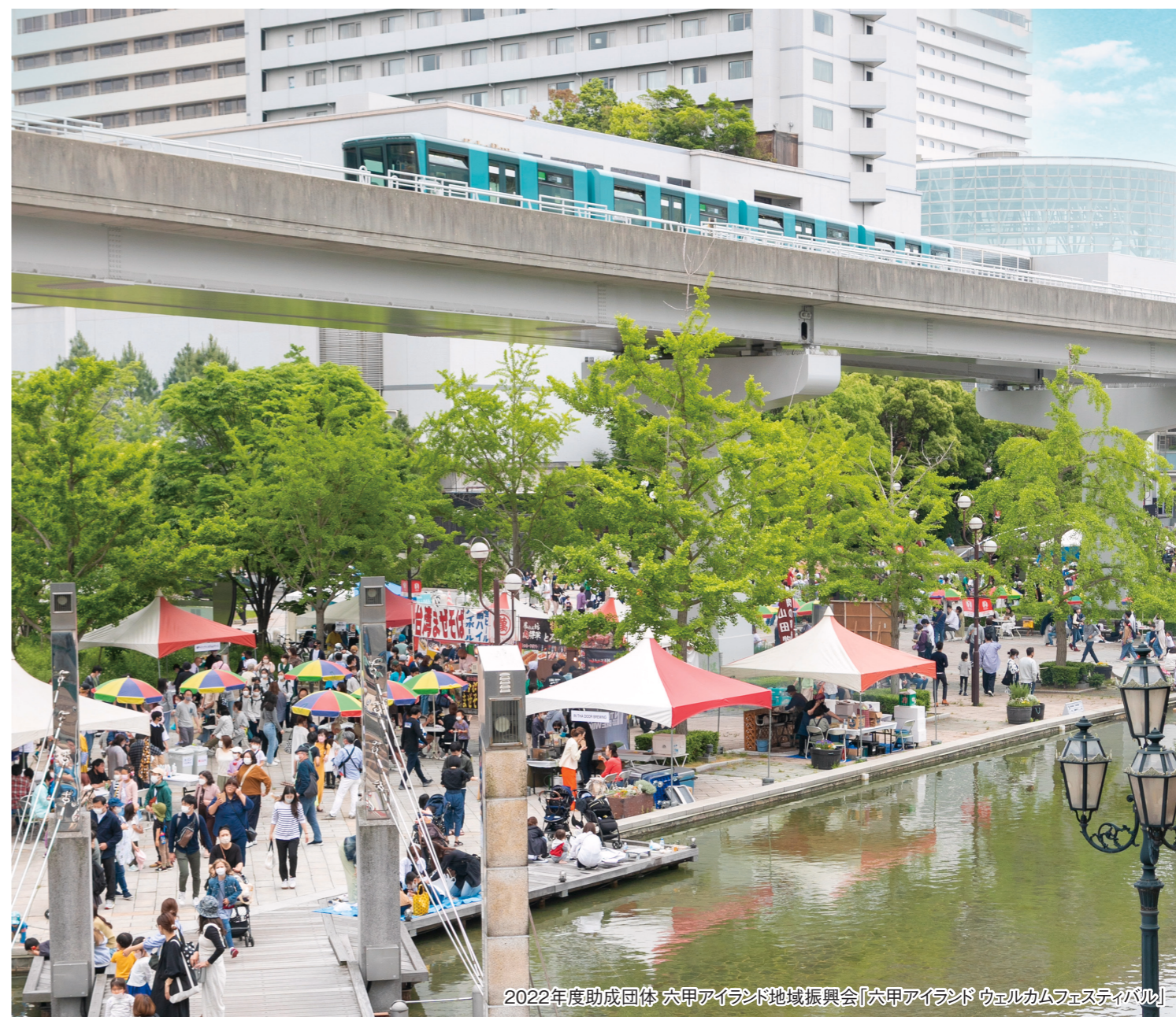
2022年度助成団体 六甲アイランド地域振興会「六甲アイランド ウェルカムフェスティバル」

〒105-8574 東京都港区芝3丁目33番1号 TEL:03-5232-8910