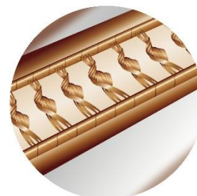
右図：髪内部の繊維がしっかりと結合した状態