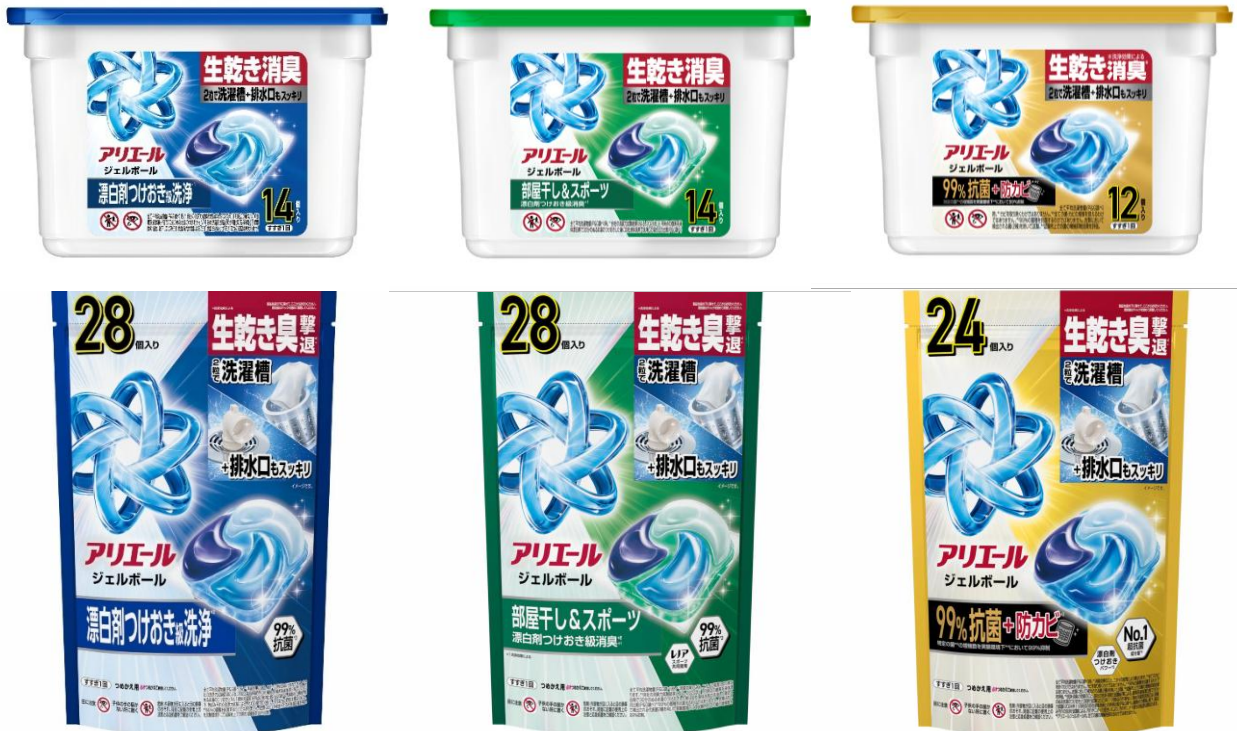
左から：「アリエール ジェルボール プロ」、「アリエール ジェルボール プロ 部屋干し用」、「アリエール ジェルボール プロパワー」