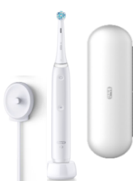
オーラル B iO4 クワイトホワイト