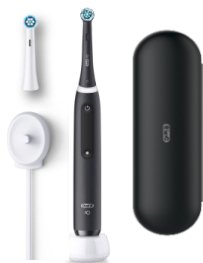
オーラル B iO5 マットブラック