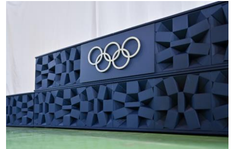
「組市松紋」を立体化した側面デザイン

デザインは東京 2020 大会のエンブレムを作成した野老朝雄氏が担当しました。野老氏による東京 2020 大会のエンブレムコンセプトである「組市松紋」を立体化した側面のデザインは、日本の伝統的デザインを幾何学的に発展させた現代日本を象徴するものです。伝統的な藍染めを想起させる色と相まって、世界へ日本らしさを発信する美しいデザインとなりました。