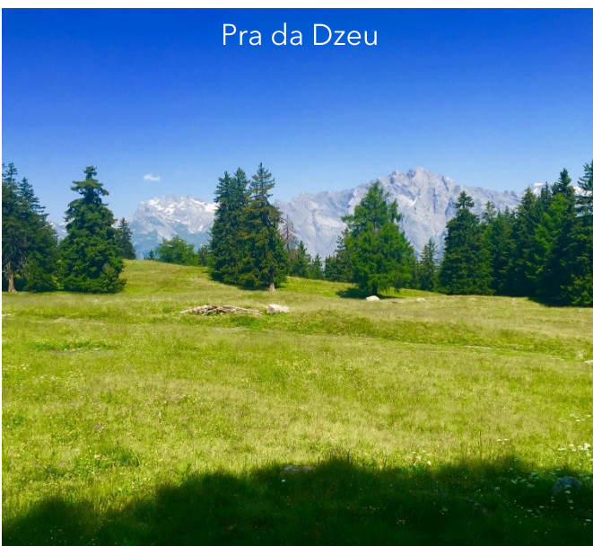
Pra da Dzeu