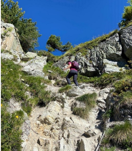
Crête Basso d'Alou - Dent de Nendaz

Variante Tracouet avec descente en télécabine