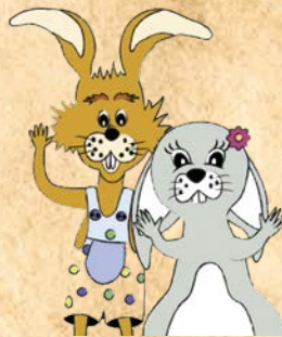
Waldi & Bella