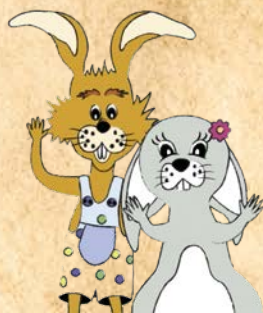
Waldi & Bella