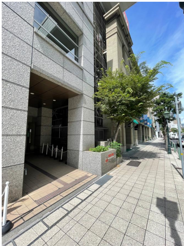
《Mitsubishi UFJ Trust and Banking Kobe Bldg.》