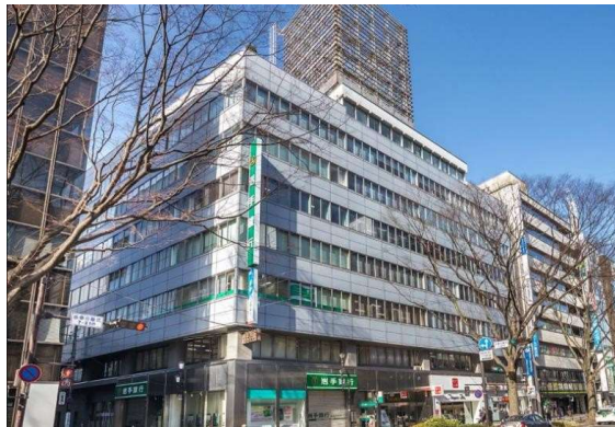
< Sento Kaikan Bldg >

Sento Kaikan Building, 2-10 Chuo 2 chome, Aoba-ku, Sendai