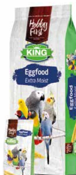
King Eggfood Extra Moist 10 kg