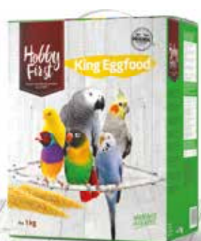
King Eggfood 4 x 1 kg