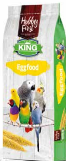
King Eggfood 10 kg