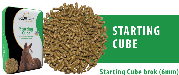
Starting Cube brok (6mm)

Starting Cube is een pellet speciaal voor veulens tot een leeftijd van 1 jaar oud. Deze pellet is afgestemd op een voorspoedige groei van het veulen. De pellet is samengesteld uit grondstoffen met een hoge biologische waarde, waaronder melkproducten. Door toevoeging van het OS-complex wordt de kans op OCD en OC verminderd. Dit mineralencomplex bevat koper, zink en mangaan in een optimale verhouding waardoor gewrichten, kraakbeen, pezen en het skelet zich ongestoord kunnen ontwikkelen.