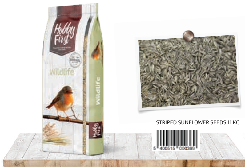
STRIPED SUNFLOWER SEEDS 11 KG

Les oiseaux de la nature raffolent des graines de tournesol. L'augmentation de la teneur en matières grasses fournit aux oiseaux la bonne quantité d'énergie. Les graines de tournesol sont très saines pour les oiseaux, mais l'idéal est de les combiner avec de la nourriture à épandre ou un mélange de graines. Les graines de tournesol servent d'alternative ou de complément à ces aliments.