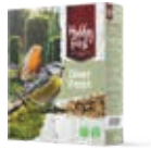
WildLife Diner Feast