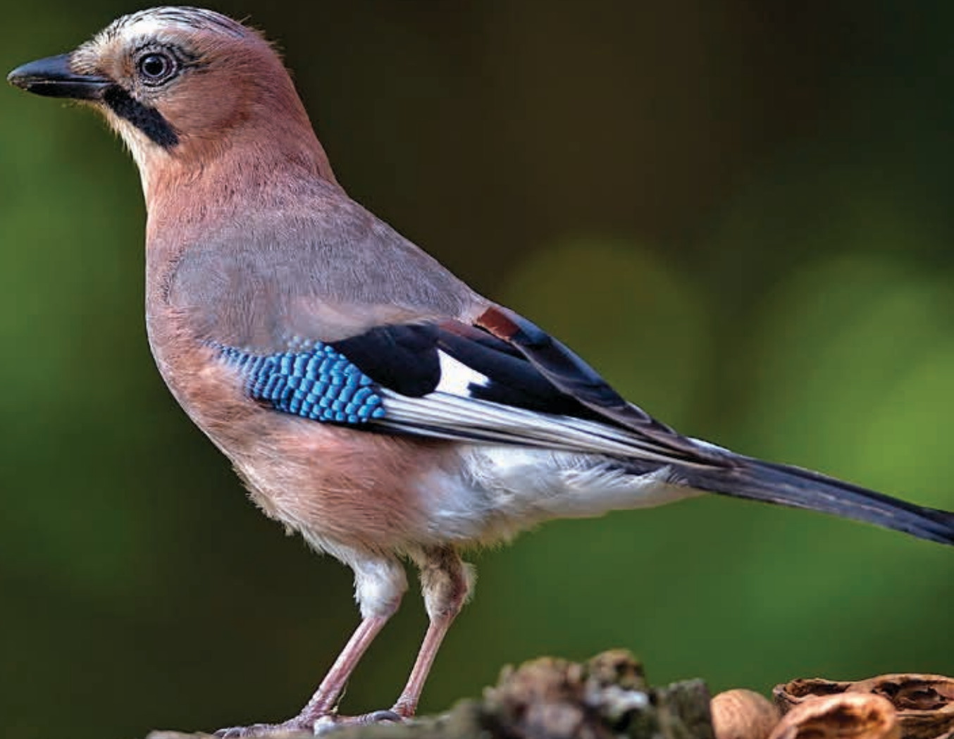
Garrulus glandarius- Jay

HobbyFirst WildLife Petits emballages 4 kg