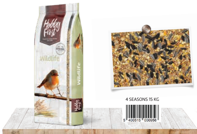
4 SEASONS 15 KG

En outre, vous fournissez aux oiseaux toutes les substances nutritives essentielles dont ils ont besoin et vous soutenez les espèces fragiles. WildLife 4 Seasons convient pour tous les oiseaux de la nature (moineaux, pinsons, mésanges bleues, merles, etc.).