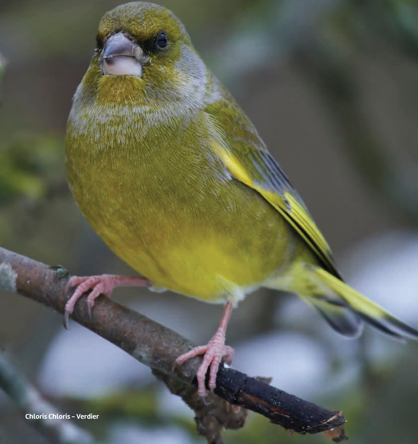
Chloris Chloris – Verdier

HobbyFirst WildLife aliment complémentaire