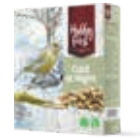
WildLife Cold at Night