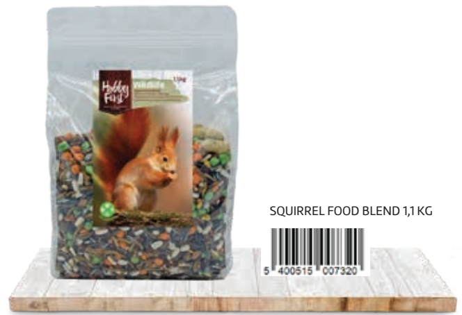
SQUIRREL FOOD BLEND 1,1 KG

Placez toujours un bol d'eau potable fraîche à côté de la nourriture pour écureuils.