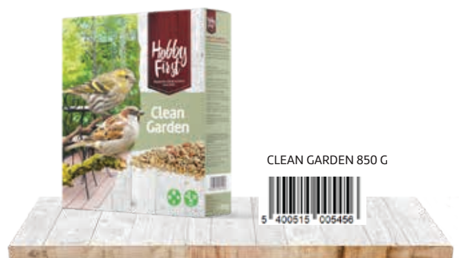
CLEAN GARDEN 850 G