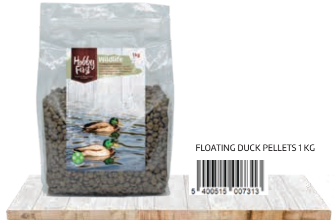
FLOATING DUCK PELLETS 1 KG

Les granulés flottants pour canards HobbyFirst WildLife sont des granulés flottants riches en protéines et à base de farine de poisson.