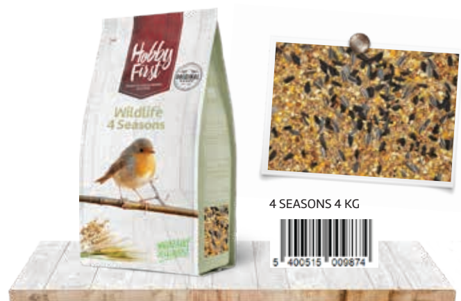
4 SEASONS 4 KG

Un plaisir supplémentaire garanti par une eau potable propre et fraîche !