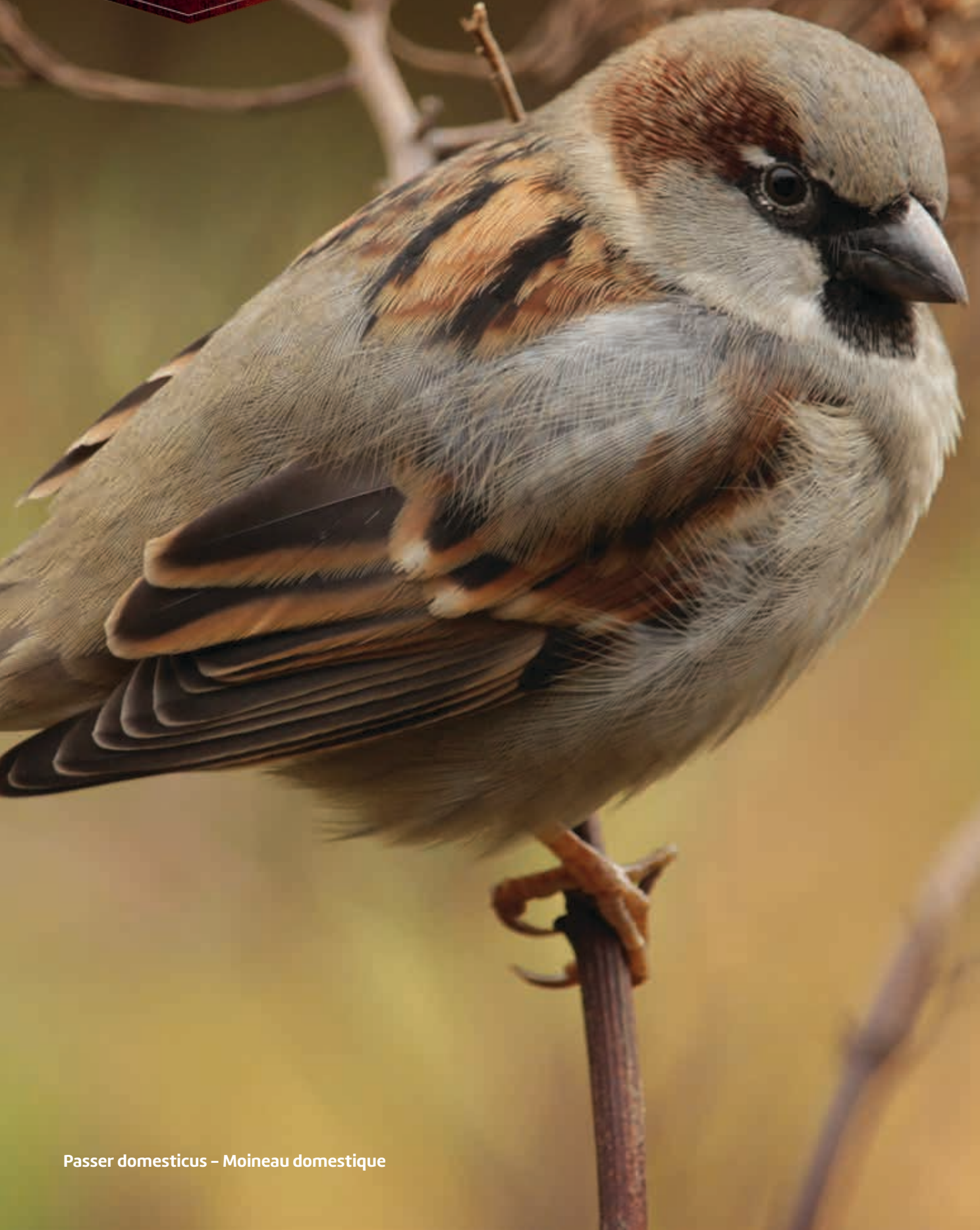
Passer domesticus – Moineau domestique

HobbyFirst WildLife Petits emballages en box présentoir