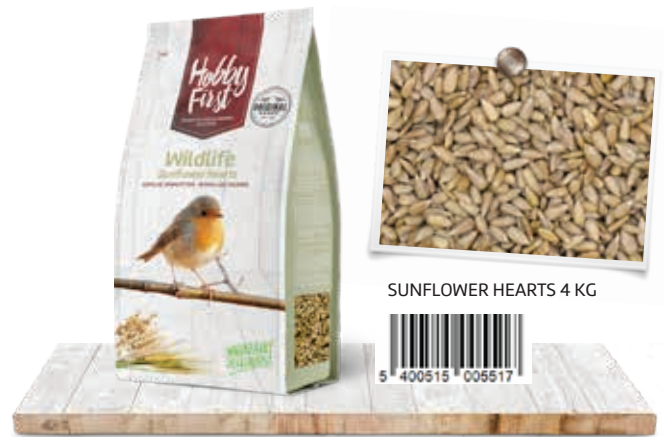
SUNFLOWER HEARTS 4 KG

Un plaisir supplémentaire assuré avec de l'eau potable pure et fraîche à côté !