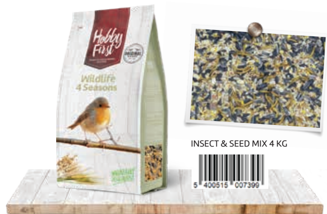
INSECT & SEED MIX 4 KG

Un plaisir supplémentaire garanti par une eau potable propre et fraîche !