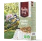
WildLife Feeder Blend