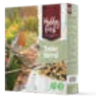
WildLife Table Blend