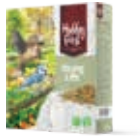
WildLife Young Life