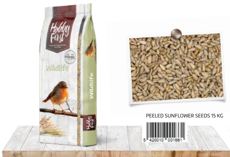
PEELED SUNFLOWER SEEDS 15 KG

Les graines de tournesol ont une teneur élevée en graisses naturelles, ce qui en fait une alimentation d'hiver par excellence. Le contenu de ce sac est assimilable à 100 % vu que les graines sont déjà décortiquées. Ainsi, il ne restera pas de résidus dans le jardin et les graines ne germeront pas dans des endroits indésirables.