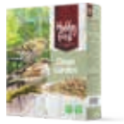
WildLife Clean Garden