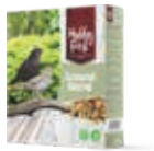
WildLife Ground Blend