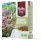
WildLife Finches & Friends