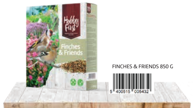
FINCHES & FRIENDS 850 G