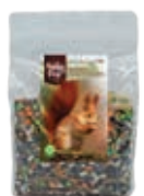
WildLife Squirrel Food Blend