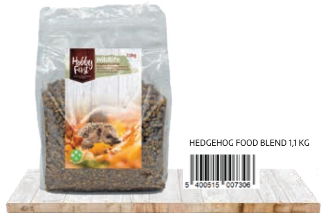
HEDGEHOG FOOD BLEND 1,1 KG

Placez toujours un bol d'eau potable fraîche avec la nourriture du hérisson.