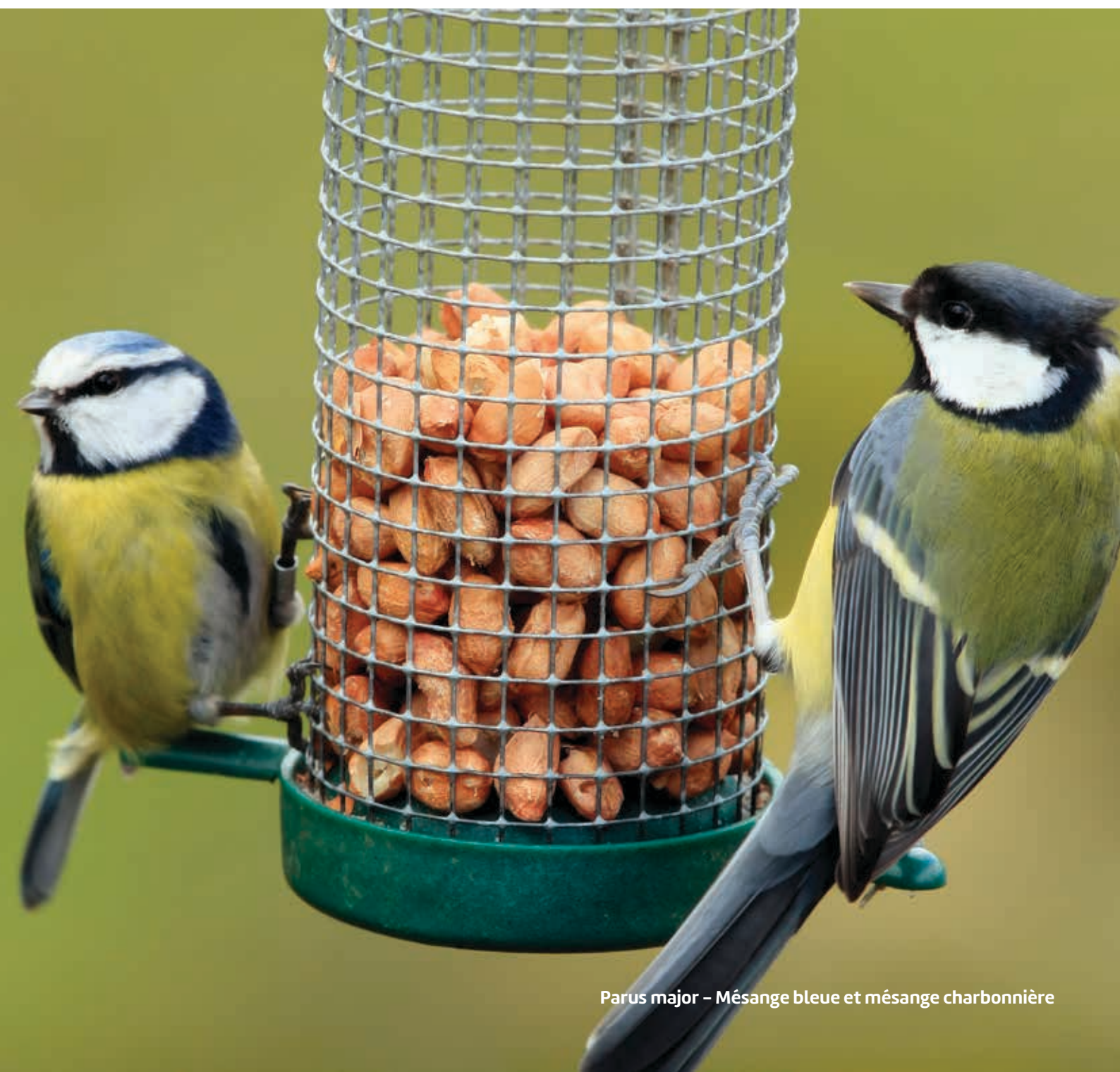
Parus major – Mésange bleue et mésange charbonnière