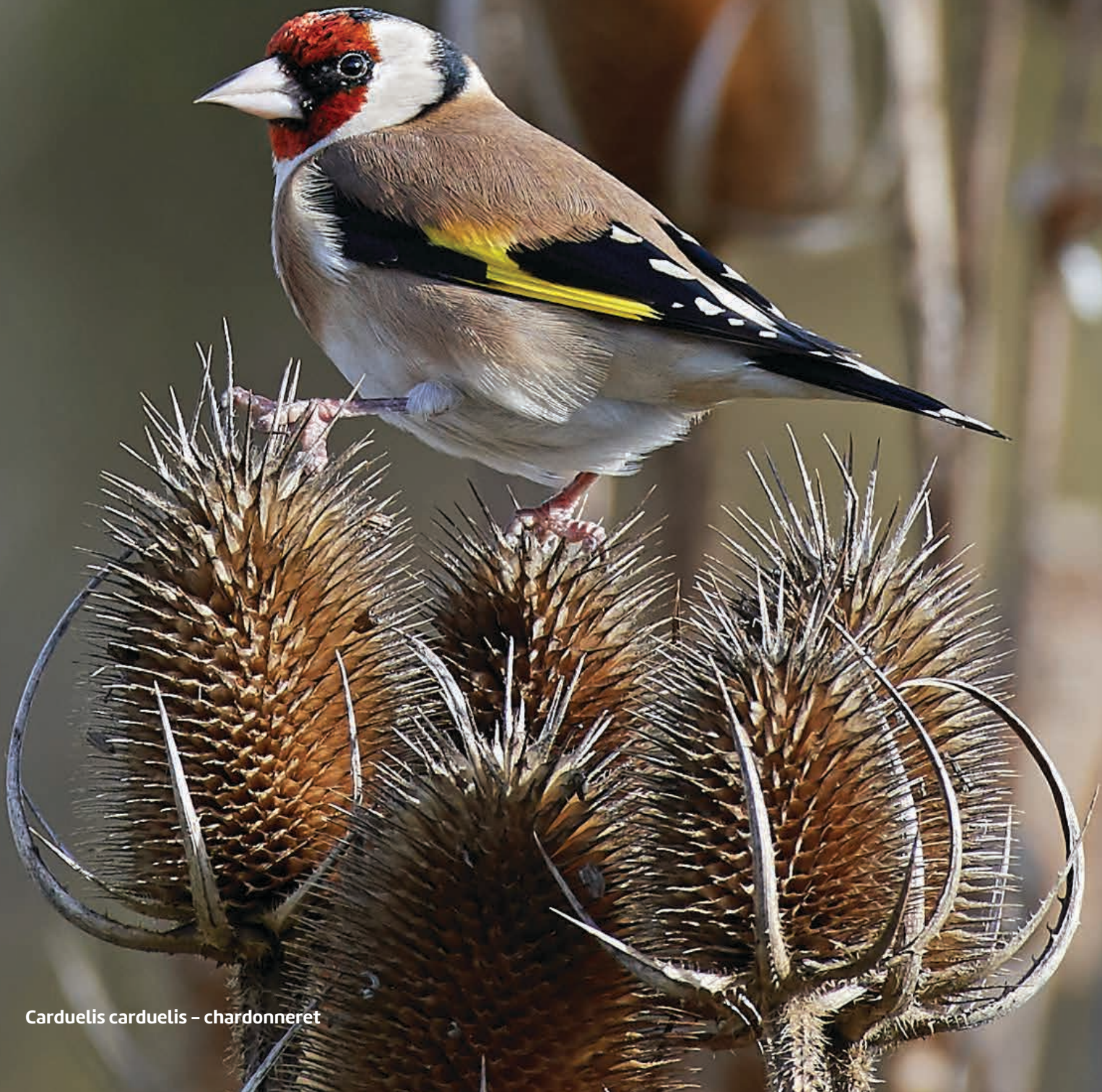
Carduelis carduelis - chardonneret