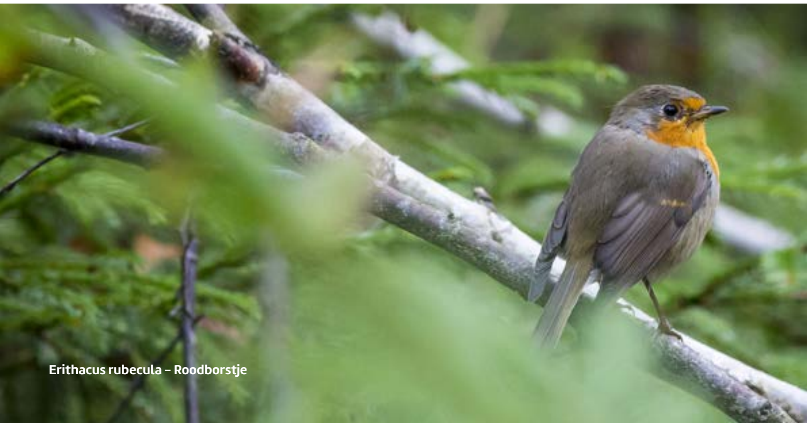
Erithacus rubecula – Roodborstje