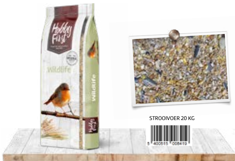
STROOIVOER 20 KG

Voor alle vrucht- en insectenetende vogels zoals; Japanse nachtegalen en spreuwensoorten