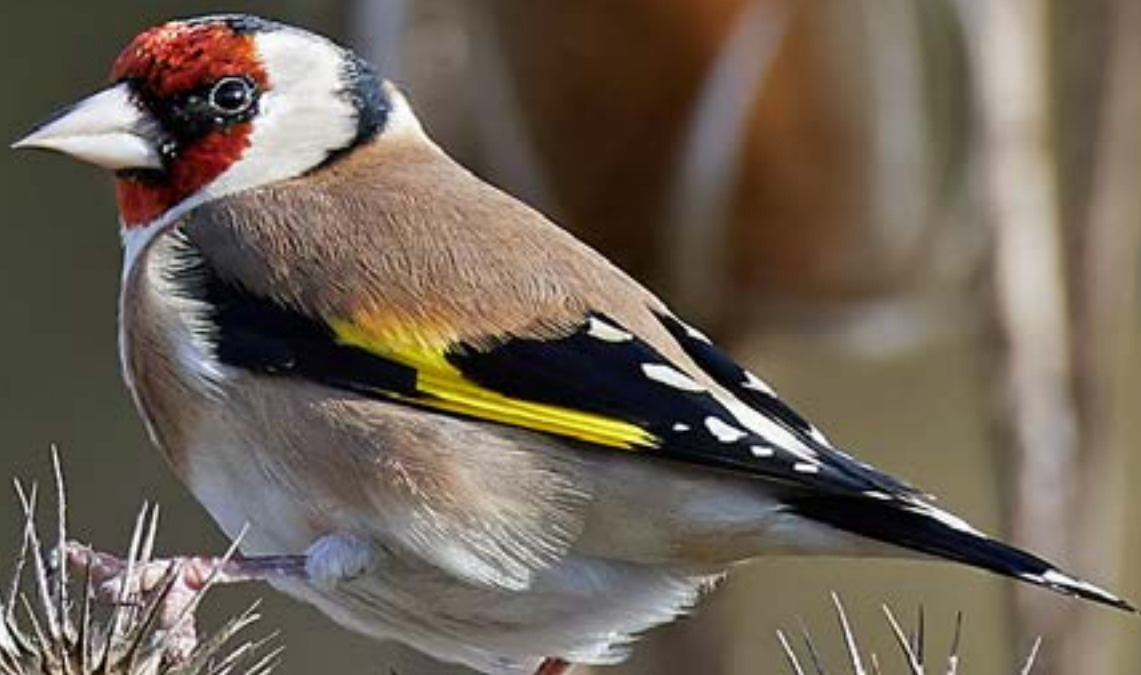
Carduelis carduelis - Putter