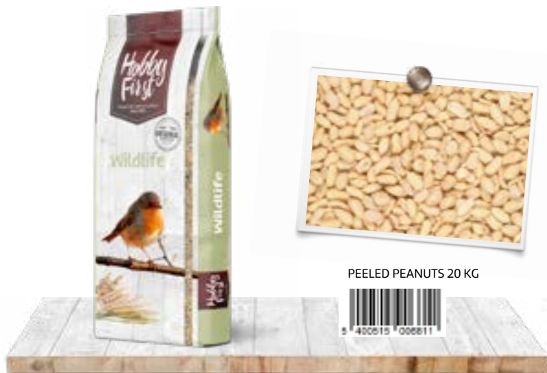
PEELED PEANUTS 20 KG

Gepelde pinda's bevatten een hoog gehalte aan vetten en eiwitten. Deze voorzien de tuinvogels van een energierijk extraatje.