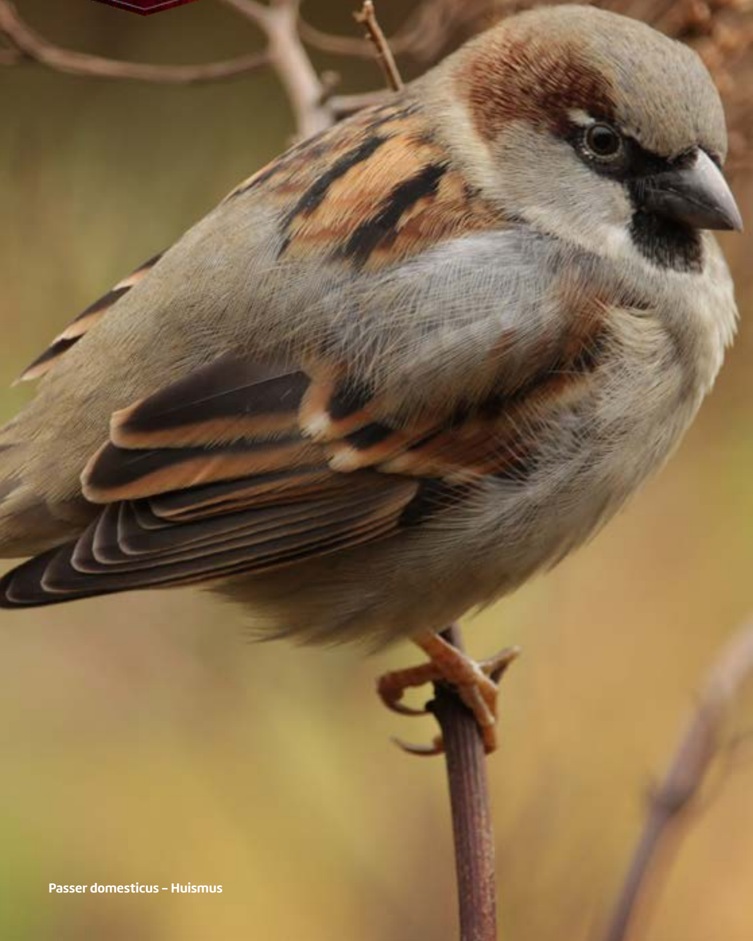
Passer domesticus – Huismus

HobbyFirst WildLife Kleinverpakkingen in display box