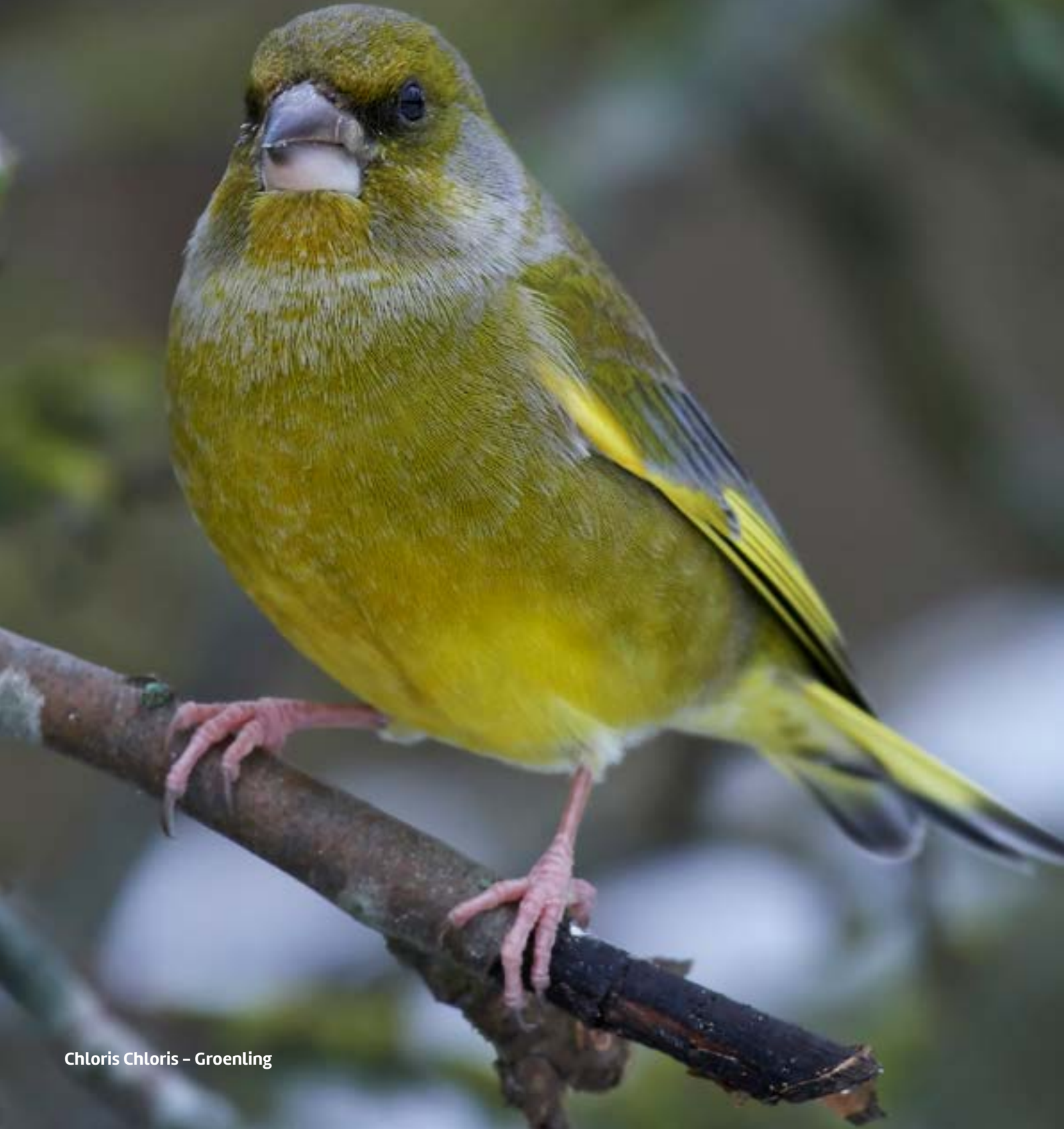
Chloris Chloris – Groenling