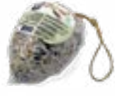
WildLife Energy Pine Cone