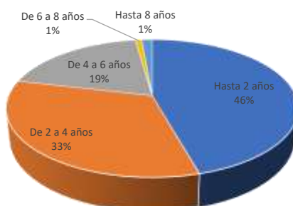
Distribución de la Cartera

Cifras Promedio del tercer Trimestre del 2022 (Cifras en millones de pesos)