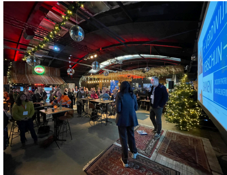
Eindcongres West-Brabant Werkt Samen met Talent in Oosterhout op 19 december, 2024

Deze manier van samenwerken laat zien dat het kán en werkt. Dat we als regio helpen met het verkennen, omarmen of benutten van mensen en hun talenten. Want daar draait het om.