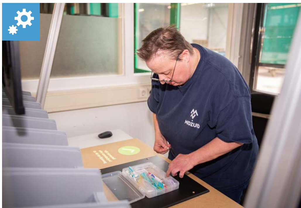
Tech for Inclusion – MidZuid