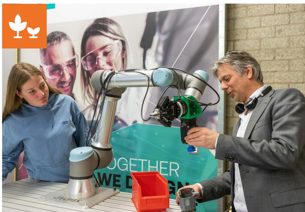
C Boost - Modoc Robots