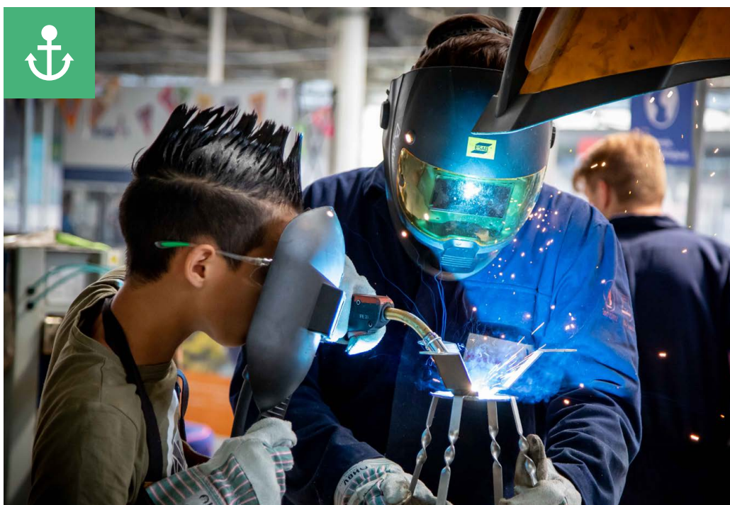
Game ON - FME