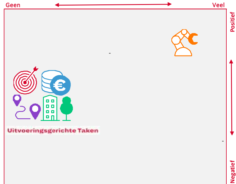
Verwacht effect corona tweede bestuursrapportage