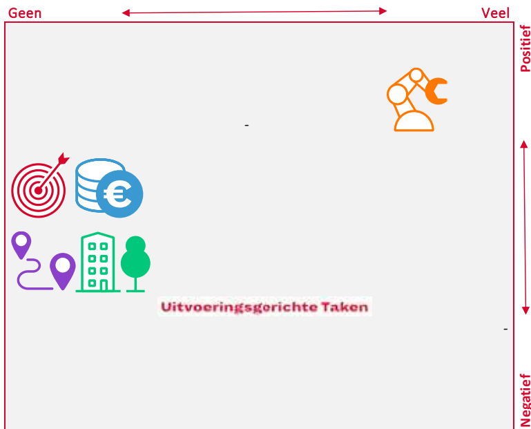
Verwacht effect corona eerste bestuursrapportage