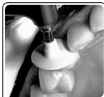
Fig. 1 - Utilize brocas carbide e/ou diamantadas finas, as pontas, discos e taças Jiffy e/ou tiras de acabamento para contorno e acabamento final da restauração.